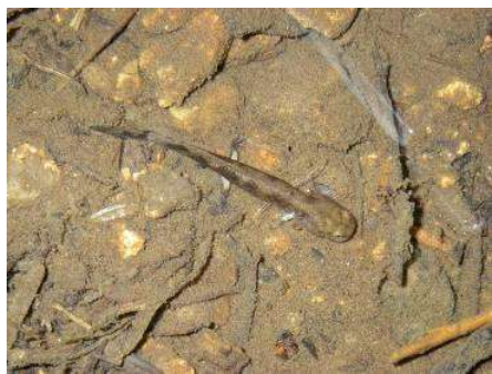
ブチサンショウウオ