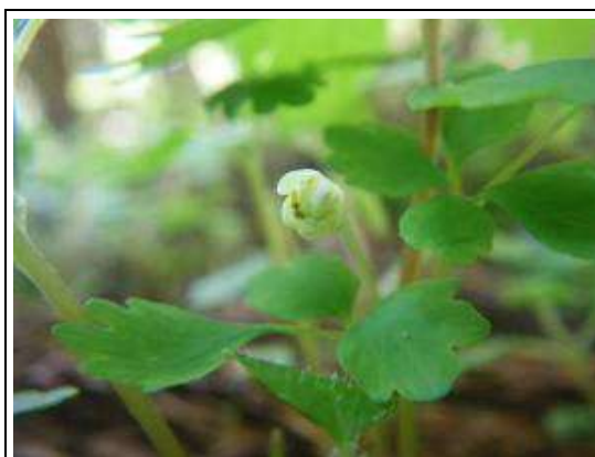
トウゴクサバノオ