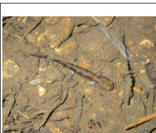
ブチサンショウウオ