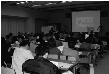
環境サポーター養成講座基礎コース

地域において、環境に配慮した生活行動を率先して行い、環境に関する普及啓発の中核を担う人材を養成するため、市内在住又は市内に通勤・通学している18歳以上の人を対象に、環境サポーター養成講座を開催しています。