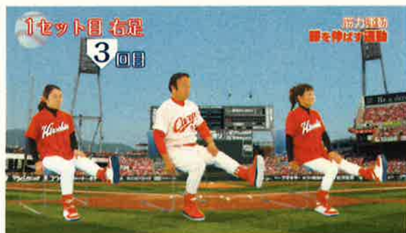
オリジナル器具を使用した体操の実演