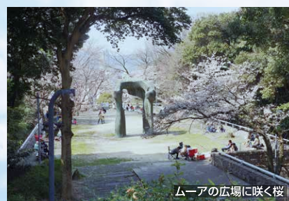
ムーアの広場に咲く桜