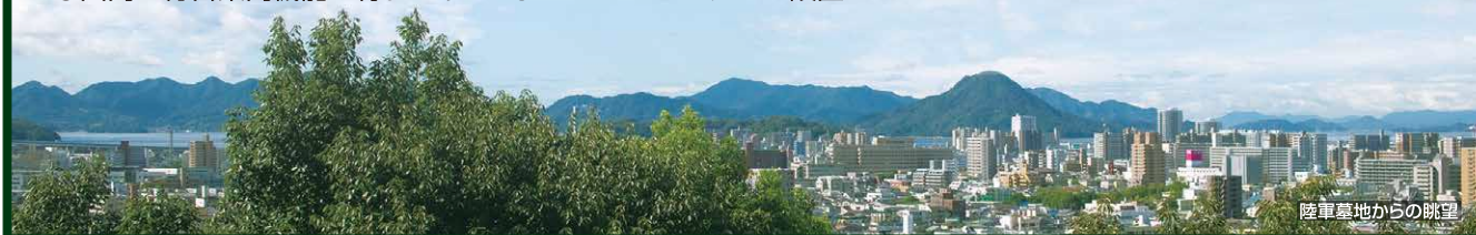
陸軍墓地からの眺望