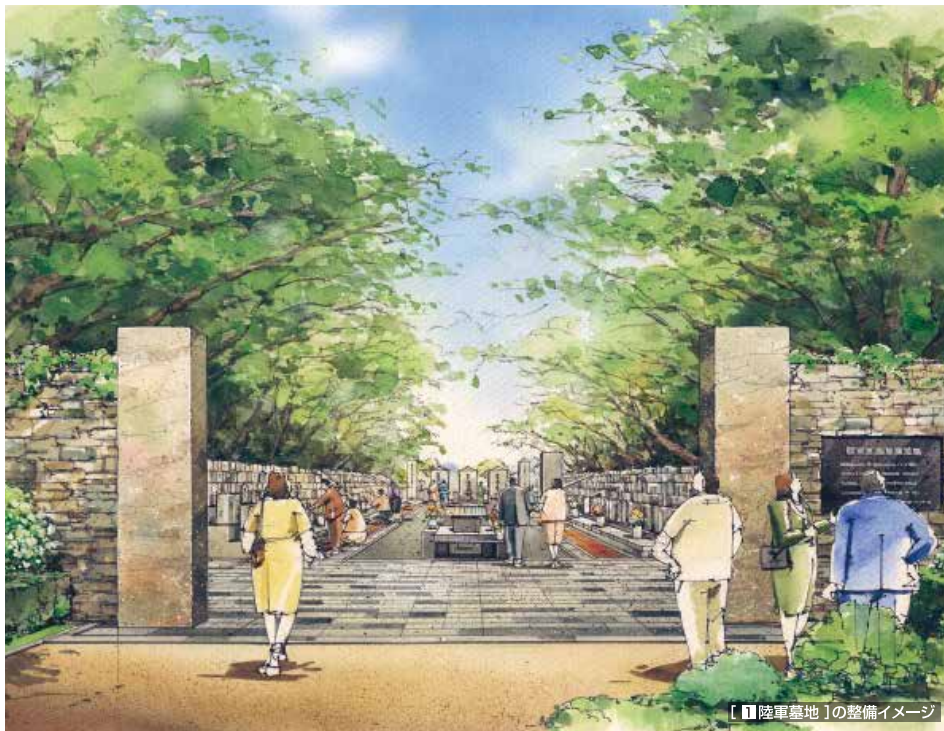
【1 陸軍墓地】の整備イメージ

明治5年に陸軍埋葬地として国が設置し、日本人戦没者の遺骨が葬られているとともに、広島で亡くなった外国人の墓もある陸軍墓地を、「博愛」のシンボルとし、市民や観光客が世界平和を願い、草花を植えることのできる花と緑の豊かな空間とします。