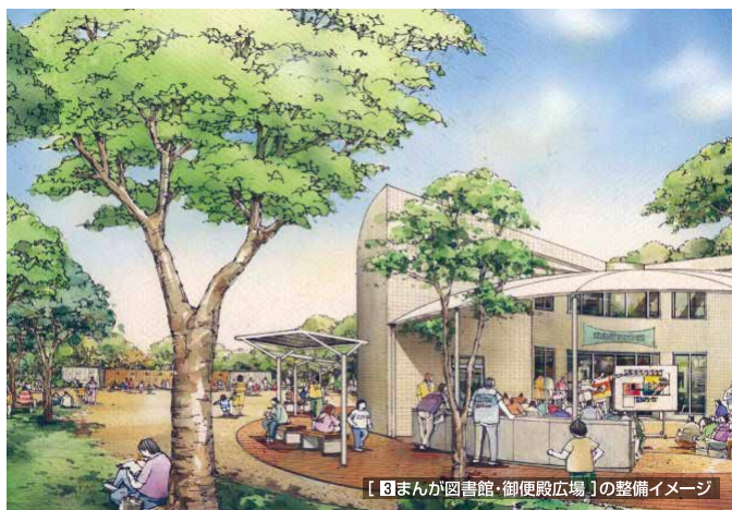
【3 まんが図書館・御便殿広場】の整備イメージ

昭和9年に頼家一族の墓地に隣接する地に建設され、昭和20年の原爆の惨禍に見舞われた頼山陽文徳殿を、被爆建物の見学会や被爆樹木の説明会など、被爆の実相を伝える場として活用するとともに、演奏会などの市民活動の場としても活用します。