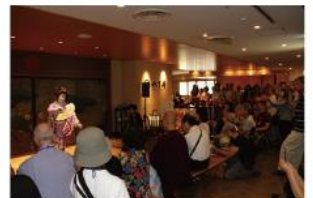
おもてなしの様子

や書道の実演、広島の特産品の紹介なども行われ、参加者に日本文化や広島の魅力を体感していただくとともに、会場を埋めつくしたゲストと市民の交流などが行われました。