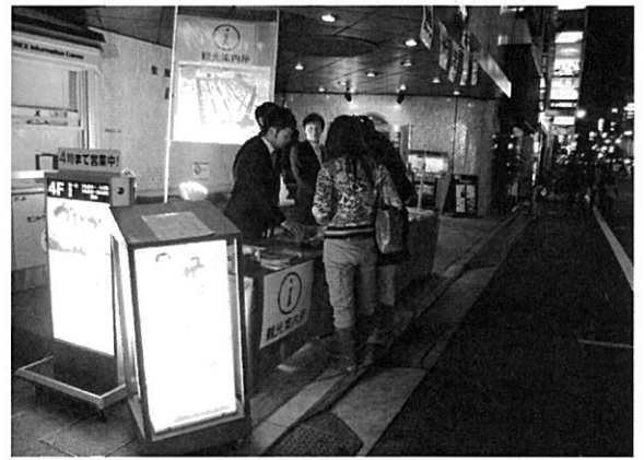
臨時観光案内所の開設 (仏だん通り)