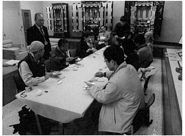
西国街道徒歩巡りツアー (仏だん店での金箔貼り体験)