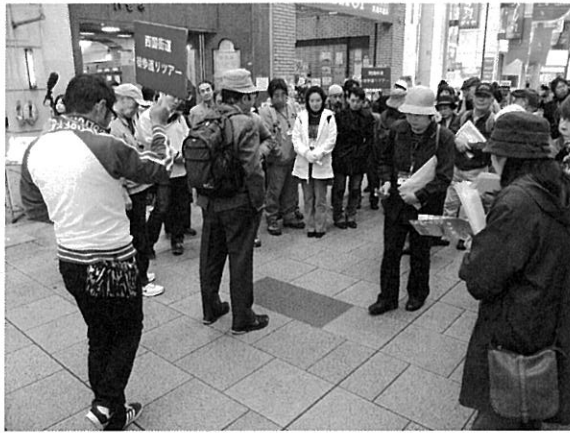
西国街道徒歩巡りツアー (江戸時代の歴史や文化の学習)