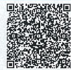
広島市防災情報メール QRコード

携帯電話からの登録は、 entry@k-bousai.city.hiroshima.jp に空メールを送信してください。