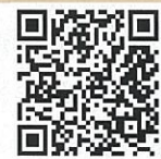
県警メールマガジン QRコード