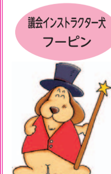
犬インストラクター フォーピン

●特別自治市 大都市が、現行制度で国や道府県の事務とされているものも含め、地方が行うべき事務の全てを一元的に担う新たな大都市制度。指定都市市長会が提案した。