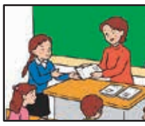
生活保護過払い金

財源の確保については、所要額全額を国において適切かつ確実に措置するよう要請しており、今後とも強く働きかけていきます。現在、県教育委員会と連携し、教員の人事交流や研修および採用試験の共同実施に取り組みしており、教員の採用についても、県教育委員会と協議を進める中で、採用試験のあり方について検討していきたいと考えています。