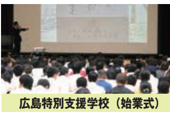
広島特別支援学校 (始業式)

児童生徒数増加に伴い、個々の児童生徒の実態に応じたきめ細かな指導・支援や職業教育の充実をさらに進めるとともに、良好な教育環境を維持していくため、分離開校も含めた抜本的な対応策を検討する必要があります。と考えており、県教育委員会や関係部局と協議しながら検討を重ねています。