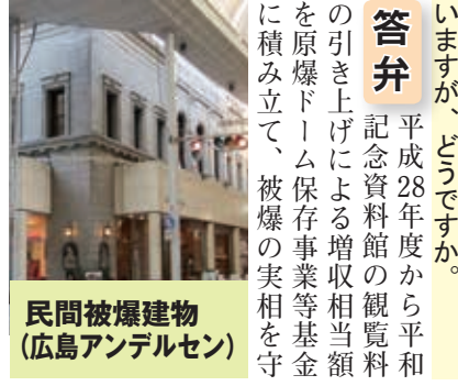
民間被爆建物 (広島アンデルセン)

土木職や建築職など女性の技術職員が産休や育児休業を取得する際に、OB技術職員を代替補充職員として事前に登録し、臨時職員等として任用する制度があれば、職員が安心して休暇を取得できると思えますが、どうですか。