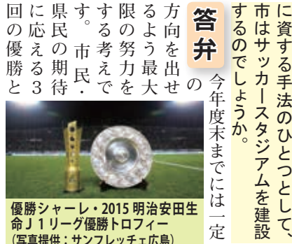
優勝シャール・2015明治安田生命J1リーグ優勝トロフィー

今年度末までには一定方向を出せるよう最大限の努力をする考えです。市民の期待に応える3回の優勝と