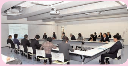
広島みらい創生高等学校視察 (10/29)