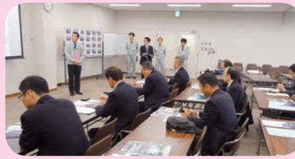
堺市災害対策センター視察 (11/14)