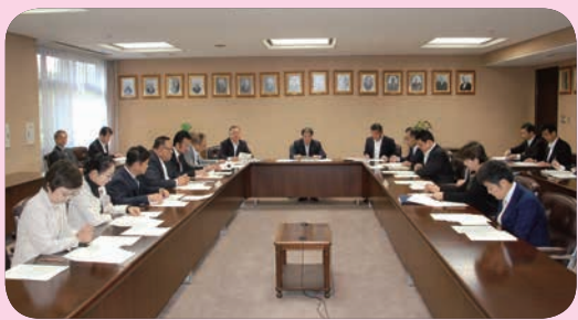
11月臨時会について協議する議会運営委員会のメンバー (10/24)

円滑な議会の運営を期するため、議会運営の全般について協議し、意見調整を図る場として設置された委員会です。