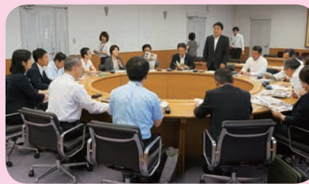
鹿児島県議会視察 (5/18)

30年は、市議会議員の選挙における選挙公報の発行及びその条例案について協議し、6月定例会へ条例案を議員提出議案として提出することとしました。また、議会による政策立案を行うための仕組みについて、5月に鹿児島県議会等の取り組みを調査し、協議しました。