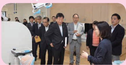
広島口腔保健センター視察 (10/4)