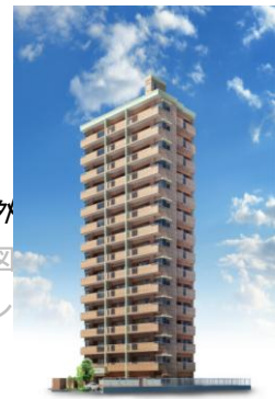
外観シミュレーション