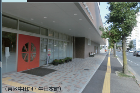
(東区牛田旭・牛田本町)