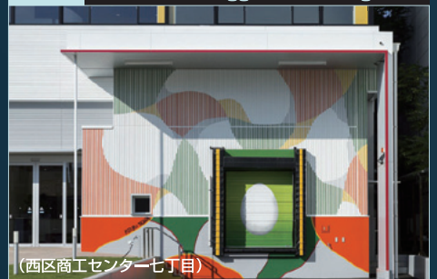
(西区商工センター七丁目)