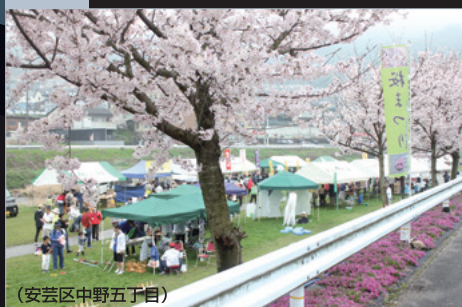
(安芸区中野五丁目)