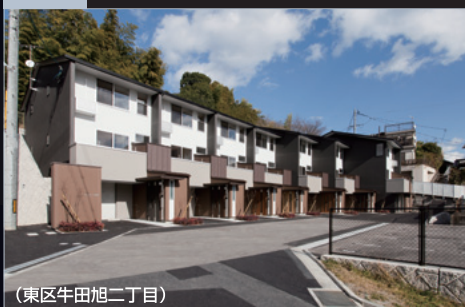
(東区牛田旭二丁目)