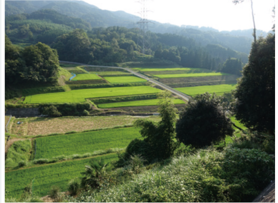
安佐北区白木町松山地区から見た田園