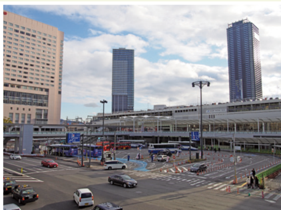
広島駅新幹線口ペDESTリアンデッキから見た新幹線口広場