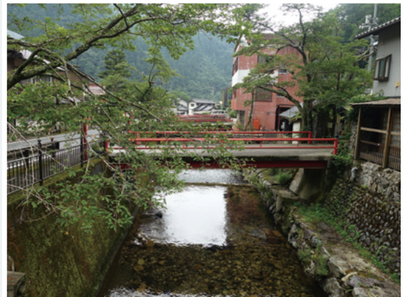
打尾谷川上流から見た湯来温泉