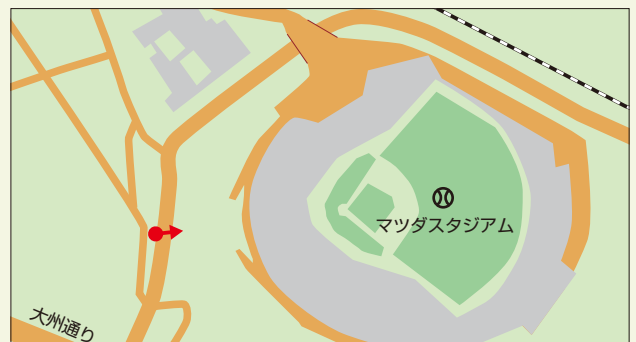
南区南蟹屋二丁目

マツダスタジアム周辺では、商業施設の整備などにより、活力とにぎわいのある広島の顔ともなる新たな景観づくりが進められており、同スタジアムの堂々たる姿は、景観づくりのシンボルとなっている。