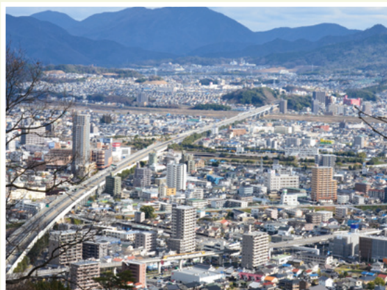
武田山から見た広島インターチェンジ周辺、市街地