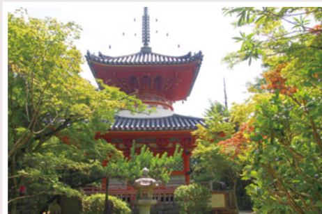
②三瀧寺参道から見た多宝塔