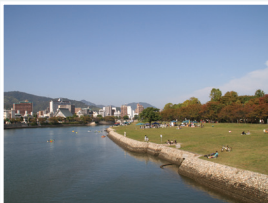
空鞆橋から見た基町環境護岸