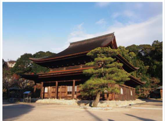
不動院境内から見た金堂