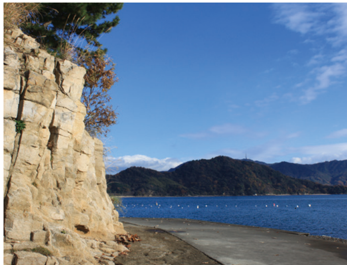
①元宇品海岸から見た瀬戸内海

瀬戸内海国立公園に指定されている元宇品では、その多様な植生の樹林や自然海岸などにより特徴付けられた瀬戸内海の自然を望むことができる。