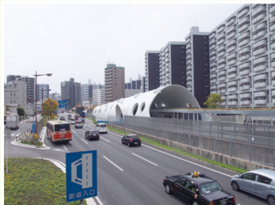
アストラムライン新白島駅北側から見た駅舎