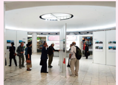
紙屋町シャレオ中央広場での市民投票の様子

※「viewtiful」は、英語の「view」（眺望）と「beautiful」（美しい）を合わせた造語です。