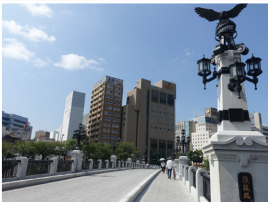
猿猴橋北詰から見た猿猴橋