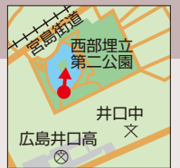
西区井口明神二丁目

西部埋立第二公園内の池の中にある小己斐島は、かつて井口の海岸線にならぶ島であった。朱塗りの鳥居が水中に立っている姿は厳島神社をほうふつさせる。