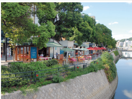
稲荷大橋から見た水辺のオープンカフェ