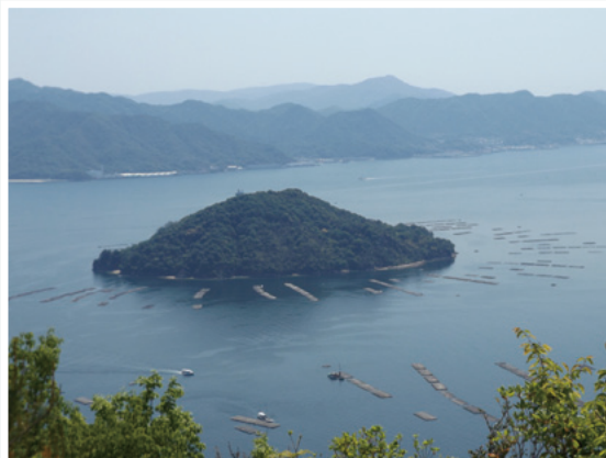
安芸小富士山頂から見た峠島、カキいかだ