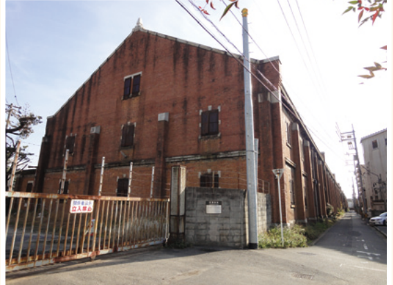
旧広島陸軍被服支廠前から見た被服支廠