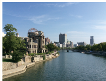
④相生橋から見た元安川下流方向