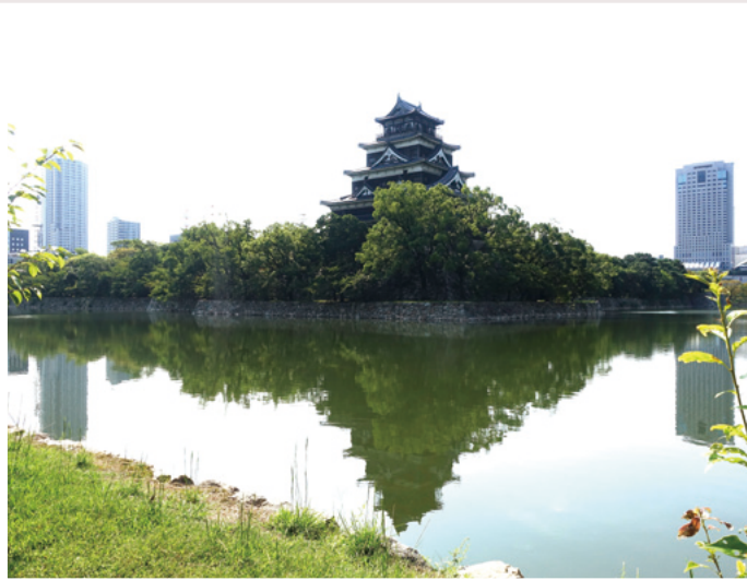
①広島城堀北側から見た天守閣

広島都市としての歴史は、広島城の築城から始まり、以降、広島は城下町として発展してきた。国の史跡指定を受けた広島城跡が、当時をしのばせている。