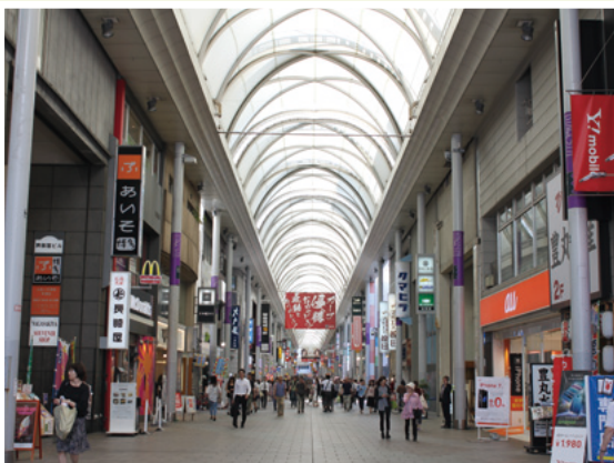
鯉城通りから見た本通り商店街東方向