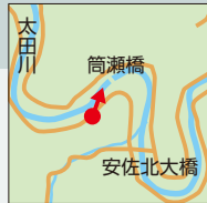
安佐北区安佐町筒瀬

太田川中流域に架かる筒瀬橋周辺は、大部分を緑濃い山地が占め、川はその谷あい を蛇行し、太田川下流部とは趣の異なる美 しい森林・河川景観を呈している。