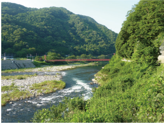
安佐北区安佐町筒瀬から見た筒瀬橋