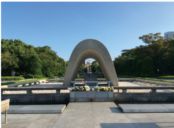
①原爆死没者慰霊碑前から見た原爆ドーム

世界遺産である原爆ドームは、人類史上最初の原子爆弾による被爆の惨禍を伝える歴史の証人であり、平和の象徴である。これらの眺望景観は、その存在感を様々な角度から確認することができる。