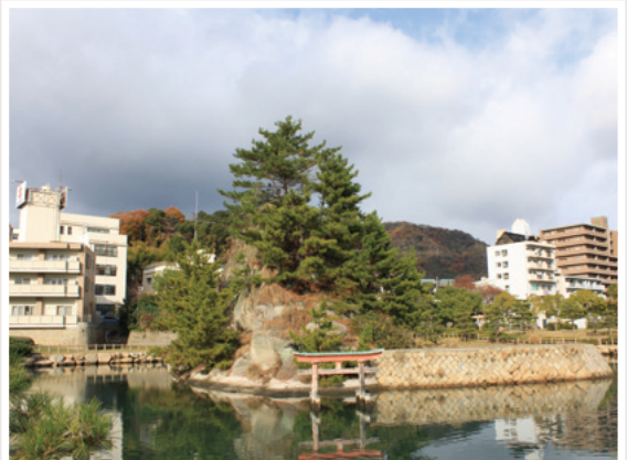
西部埋立第二公園から見た小己斐島