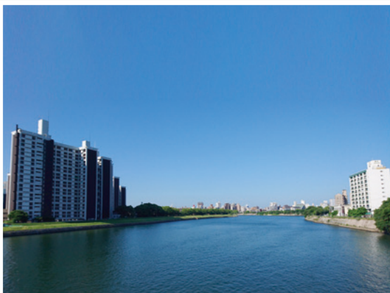
三篠橋から見た太田川、基町住宅、基町環境護岸