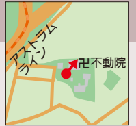
東区牛田新町三丁目

国宝の金堂、重要文化財に指定されている楼門、鐘楼などがある不動院の境内からは、その歴史の深みあるたたずまいと調和した景観を望むことができる。