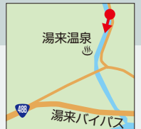
佐伯区湯来町多田

湯来温泉周辺は、豊かな自然環境や新た な交流施設を生かし、観光促進、おもてな しの雰囲気づくりに取り組みながらも、歴 史ある温泉地としての風情を今に残してい る。