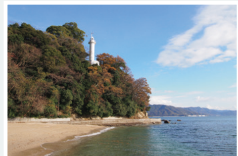
②元宇品海岸から見た宇品燈台