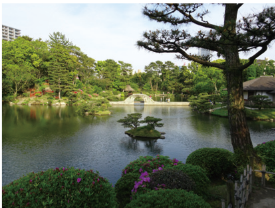
縮景園内超然居から見た広島駅方向