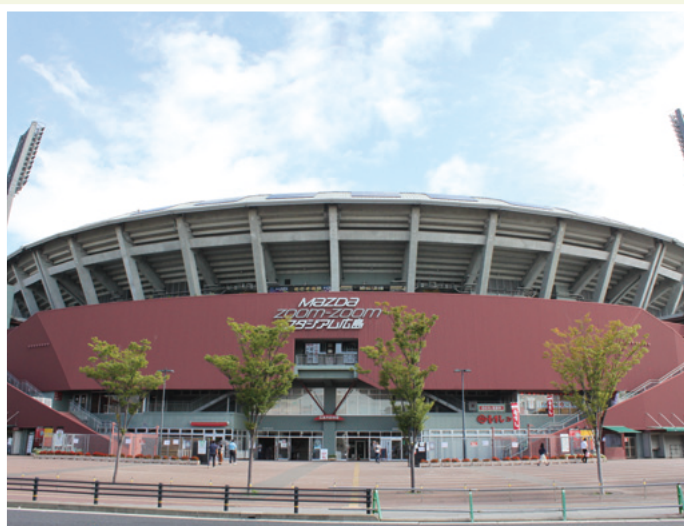
マツダスタジアム前から見たマツダスタジアム