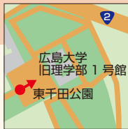
中区東千田町一丁目

広島大学本部跡地にある東千田公園は、都心に数少ない大規模な市民の憩いの場であり、戦後世界各国から贈られた樹木が、今も力強く息づいている。