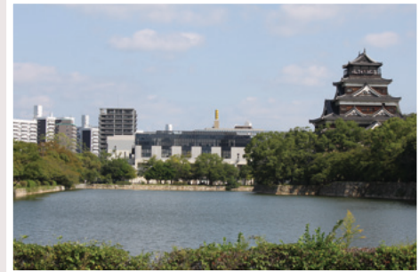
②広島城堀南側から見た天守閣