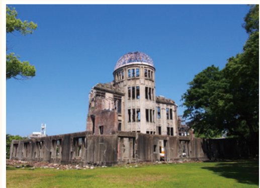
②原爆ドーム東側から見た原爆ドーム