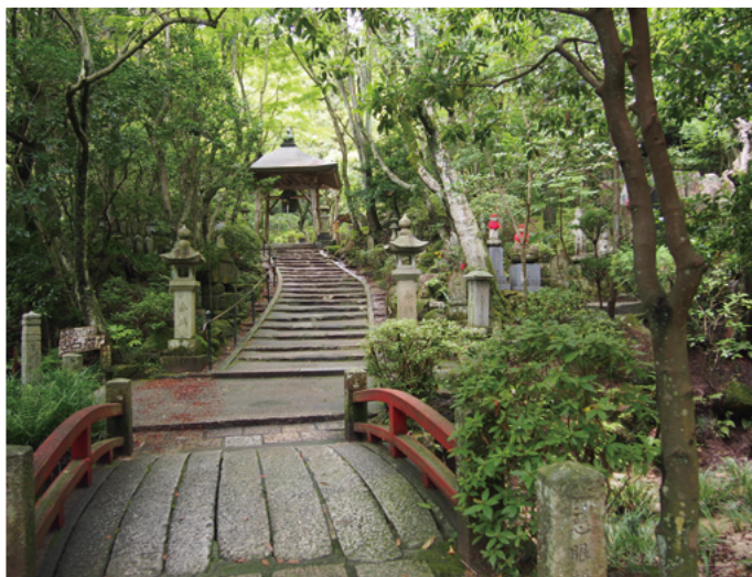
①三瀧寺参道から見た鐘楼

三瀧寺境内では、室町時代末期に建立されたとされる多宝塔などの歴史的・文化的な建造物と、豊かな自然環境が調和した景観が形成されている。