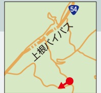
安佐北区白木町市川

山あいにも幾重にも広がる棚田は、中国山 地につながる山間部の田園風景を代表する 貴重な景観資源であり、心いやされるのど かな風景が広がっている。