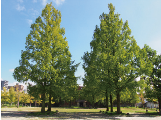
東千田公園から見た広島大学旧理学部1号館