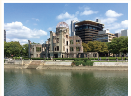
⑤原爆ドーム対岸から見た原爆ドーム