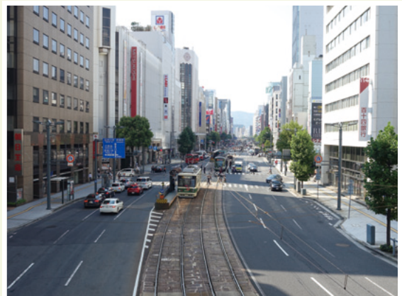
中区織町南横断歩道橋から見た相生通り西方向