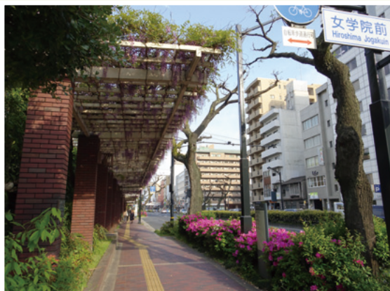
広島女学院前から見た藤棚の道