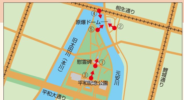
中区中島町、大手町一丁目