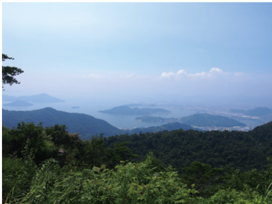
絵下山展望台から見た瀬戸内海