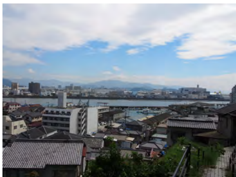
090 84江波山から見た街並み、かきいかだ