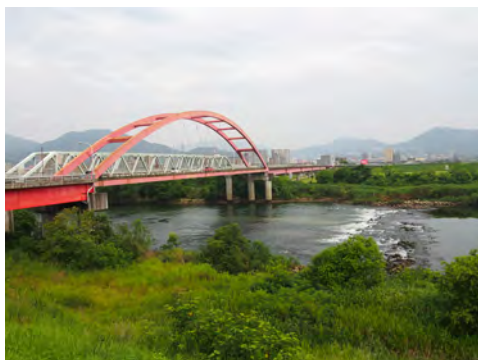
047 55安芸大橋南詰付近から見た安芸大橋、太田川下流方向