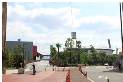
065 88西蟹屋プロムナードから見た広島市民球場