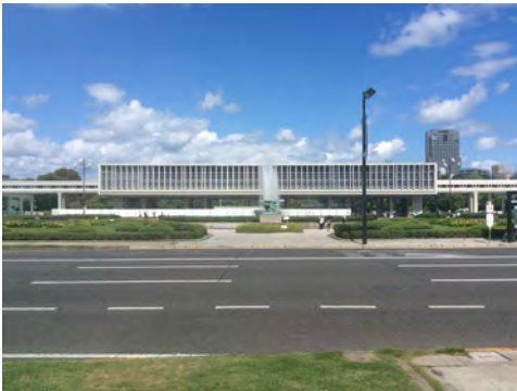
026 7平和大通りから見た平和記念資料館