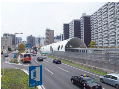
019 99アストラムライン新白島駅北側から見た駅舎