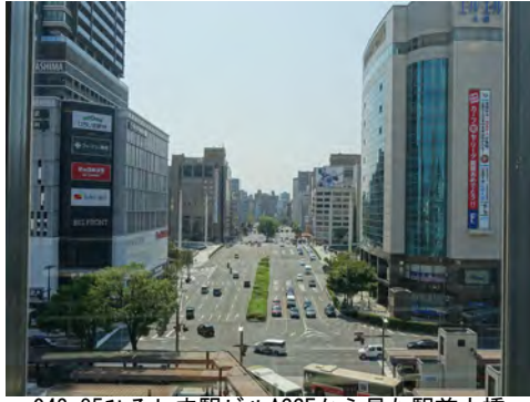
042 85ひろしま駅ビルASSEから見た駅前大橋