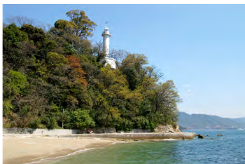
006 (011) 60元宇品海岸から見た宇品燈台