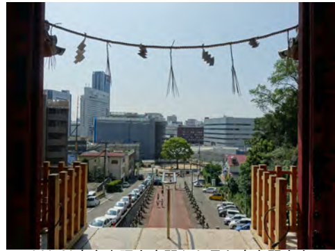
044 20広島東照宮唐門から見た広島駅方向