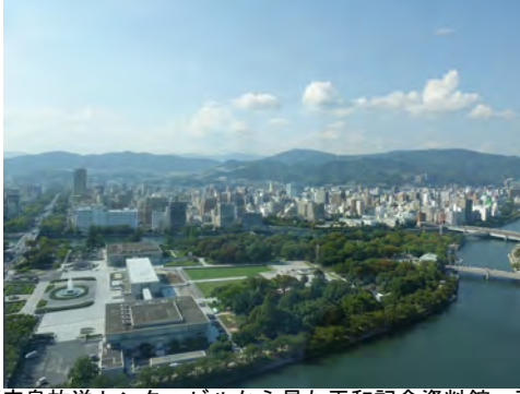
052 10NHK広島放送センタービルから見た平和記念資料館、平和大通り052 68マリーナホップブロムナードデッキから見た観音マリーナ