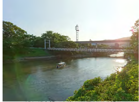
054 45京橋川左岸から見た工兵橋