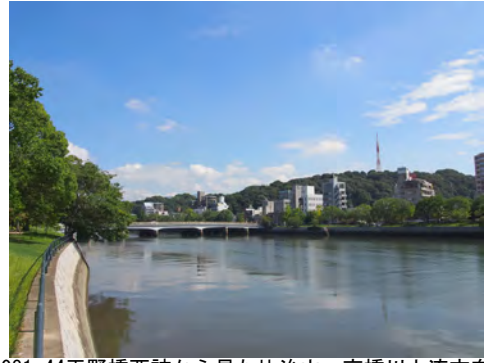
081 44平野橋西詰から見た比治山、京橋川上流方向