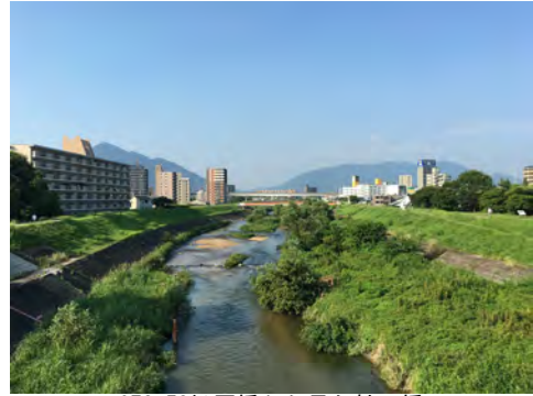
072 53松原橋から見た神田橋