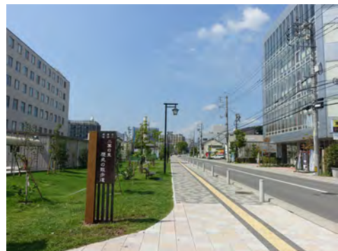
087 31東区光町から見た二葉の里歴史の散歩道