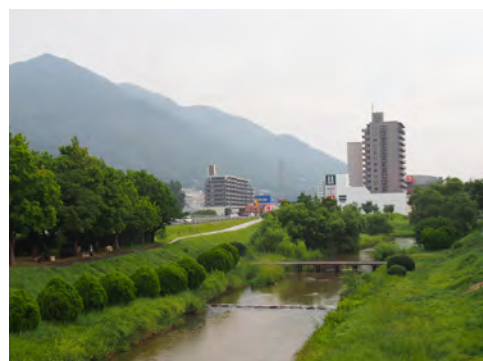
071 54せせらぎ公園から見た阿武山