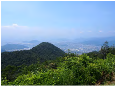
062 75絵下山展望台から見た市街地