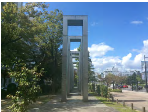
065 14平和大通りから見た平和の門