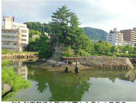
012 51西部埋立第二公園から見た小己斐島