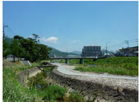
056 57瀬野川河川敷から見た中野砂走の出迎いの松