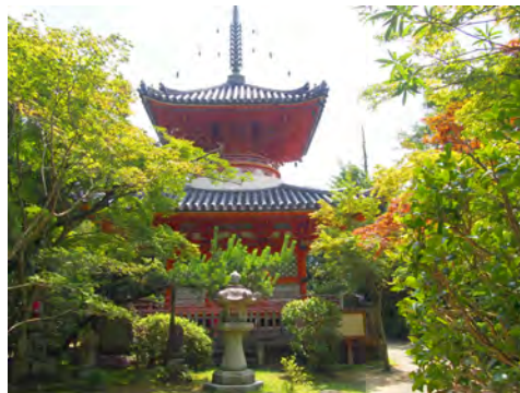
004 (016) 23三瀧寺参道から見た多宝塔