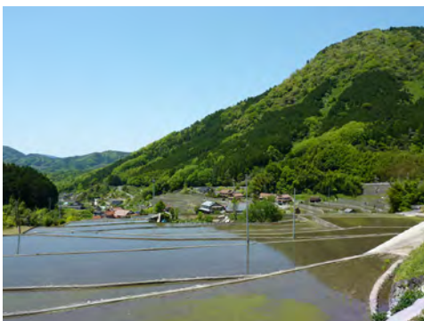
028 69安佐北区安佐町鈴張から見た棚田