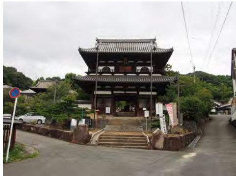
074 26國前寺前から見た山門