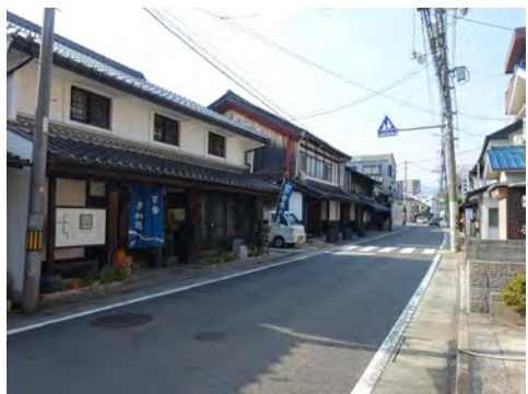
029 33安佐北区可部から見た可部夢街道