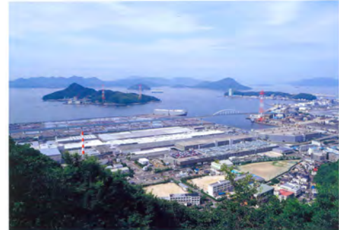
039 74黄金山展望台から見た南区宇品方向