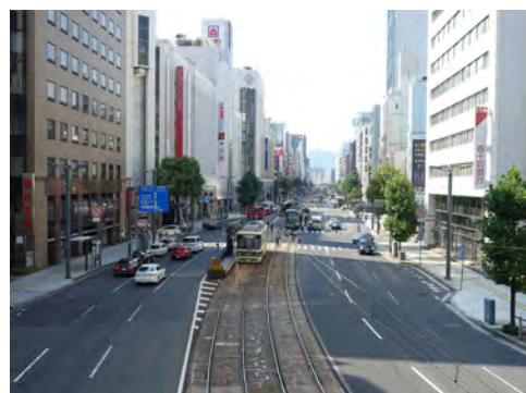
021 92中区鞆町南横断歩道橋から見た相生通り西方向