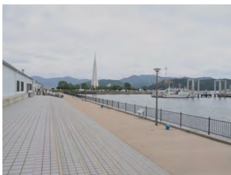
049 64宇品海岸プロムナードから見た宇品波止場公園