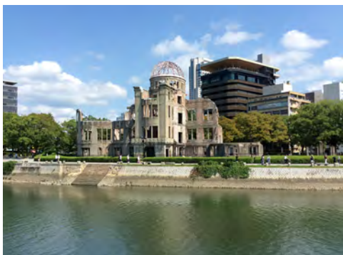
003 (009) 5原爆ドーム対岸から見た原爆ドーム