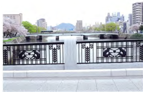
036 36猿猴橋から見た荒神橋、黄金山