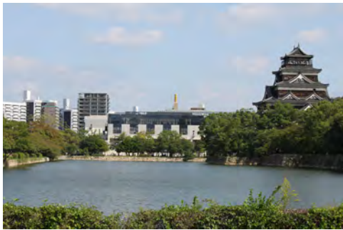
002 (030) 28広島城堀南側から見た天守閣