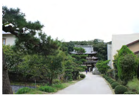
061 24不動院参道から見た楼門