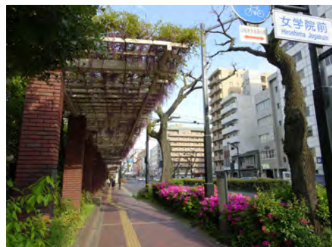
019 97広島女学院前から見た藤棚