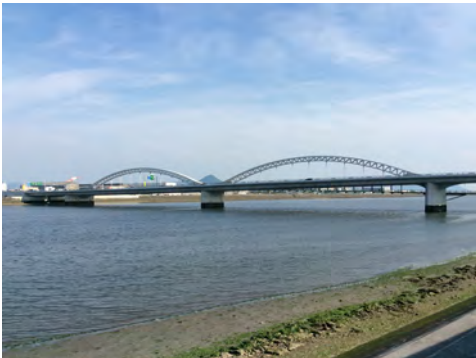
056 49太田川放水路右岸から見た太田川大橋