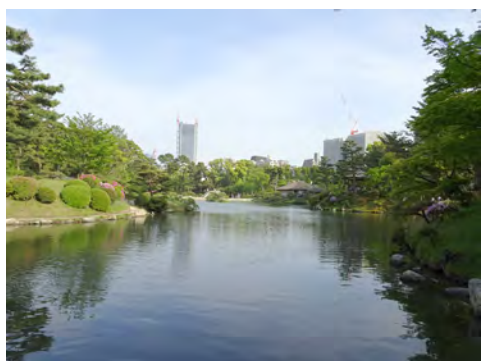
031 19縮景園内濯纓池西側から見た広島駅方向