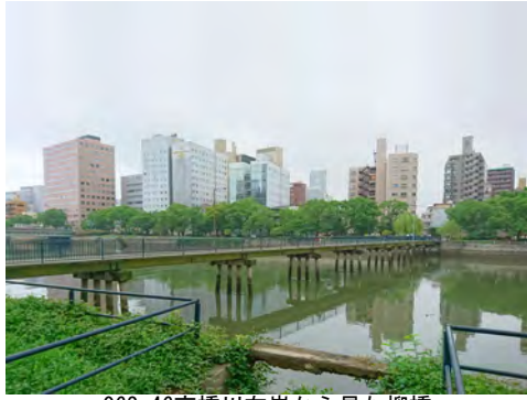
062 46京橋川右岸から見た柳橋