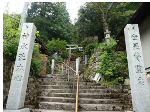
049 27湯山明神社参道から見た湯ノ山旧湯治場付近