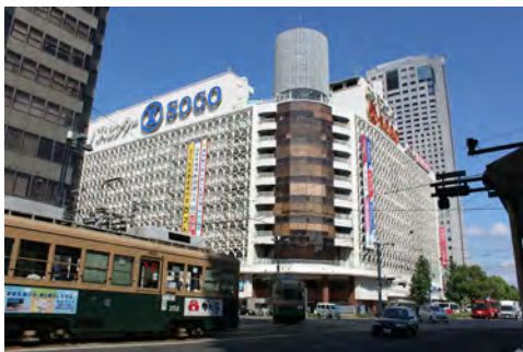
037 90中区紙屋町から見た紙屋町交差点