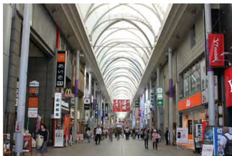
007 96鯉城通りから見た本通り商店街東方向