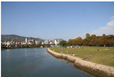
018 38空鞆橋から見た基町環境護岸