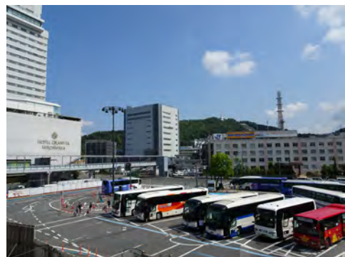
089 86広島駅新幹線口ペDESTロリアンデッキから見た二葉山方向