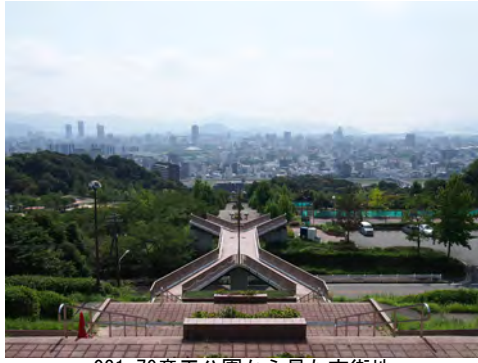
031 79竜王公園から見た市街地