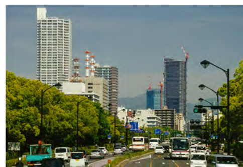
090 93城南通りから見た広島駅方向