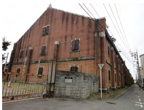
011 16旧広島陸軍被服支廠前から見た被服支廠