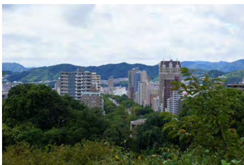
065 72比治山第二駐車場から見た平和大通り