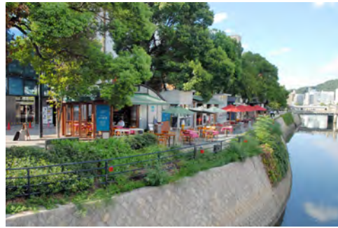
015 40稲荷大橋から見た水辺のオープンカフェ