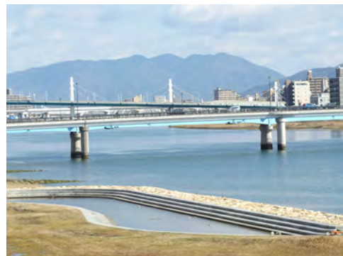
077 48新己斐橋から見た己斐橋、広島高速4号線