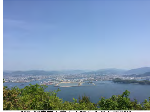
062 67安芸小富士山頂から見た市街地