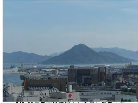
043 83広島市役所屋上から見た似島方向