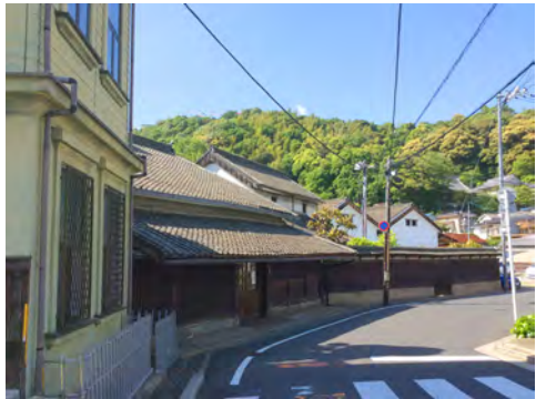
027 32西区草津から見た草津街道