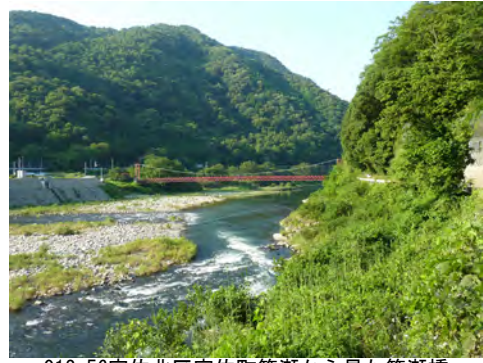
012 56安佐北区安佐町筒瀬から見た筒瀬橋