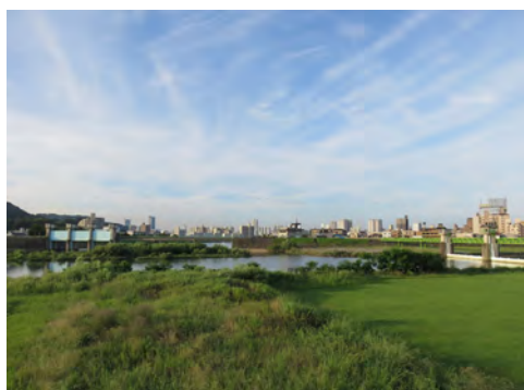
078 50太田川放水路右岸から見た祇園水門、大芝水門