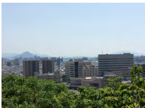
080 71比治山展望台から見た南区皆実町方向