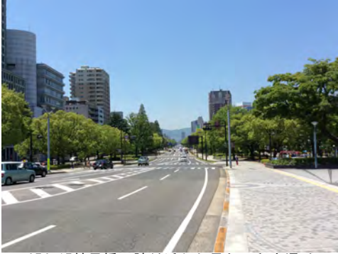
054 15鶴見橋西詰付近から見た平和大通り