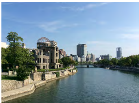
003 (010) 4相生橋から見た元安川下流方向