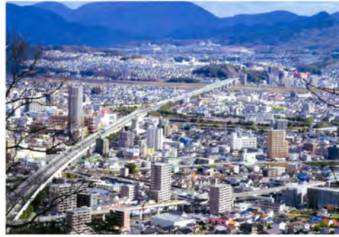
023 81武田山から見た山陽道、市街地