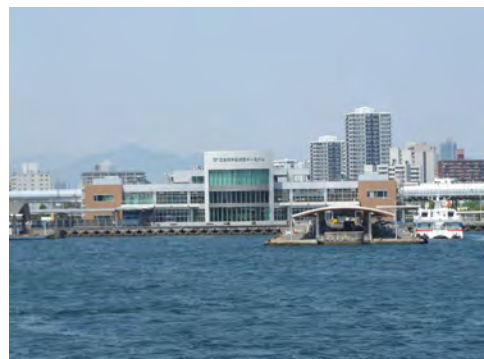
041 65広島港沖から見た広島港