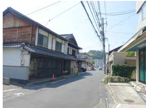
075 34安芸区船越から見た西国街道