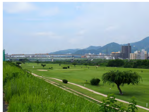
047 52東区戸坂方面から見た祇園新橋