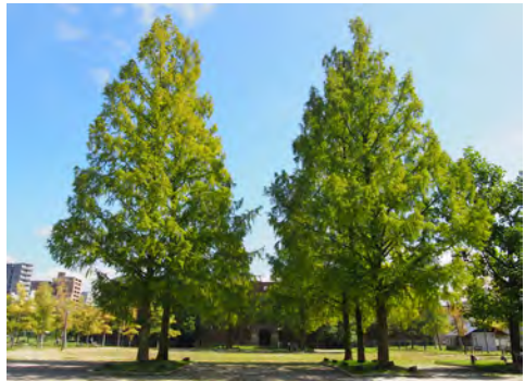
025 95東千田公園から見た広島大学旧理学部1号館