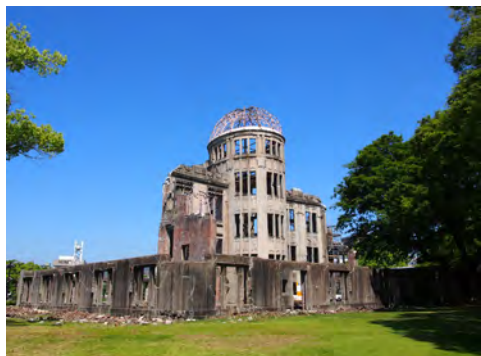
003 (007) 6原爆ドーム東側から見た原爆ドーム