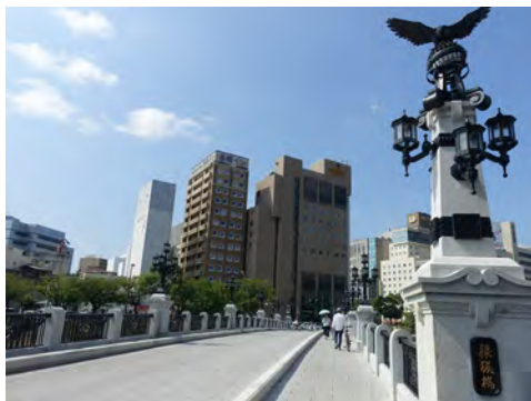
016 35猿猴橋北詰から見た猿猴橋