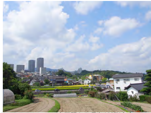
065 100アストラムライン大塚駅から見たACITY方向（西風新都）