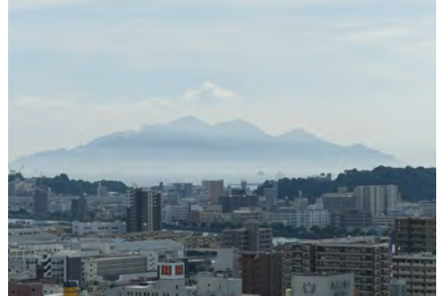
056 82広島市役所屋上から見た宮島方向