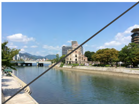
003 (015) 3元安橋西詰から見た原爆ドーム