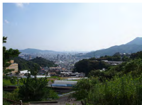
078 80毘沙門天参道付近から見た市街地