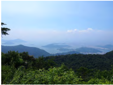
014 76絵下山展望台から見た瀬戸内海