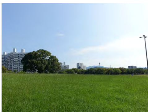
065 94中央公園から見た基町住宅、広島城