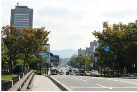
072 13西平和大橋から見た平和大通り、比治山