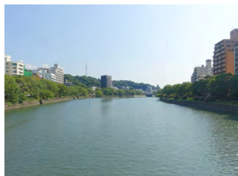
081 41東広島橋から見た河岸緑地