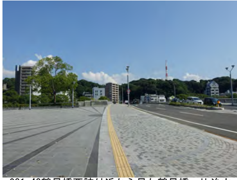
081 43鶴見橋西詰付近から見た鶴見橋、比治山