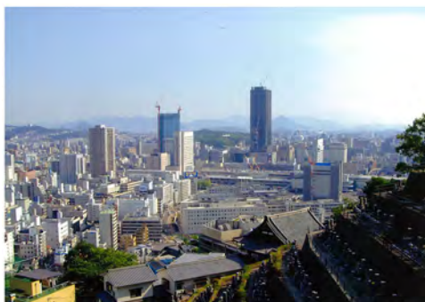
060 77東区二葉山仏舎利塔から見た広島駅方向