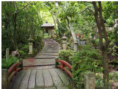
004 22三瀧寺参道から見た鐘楼