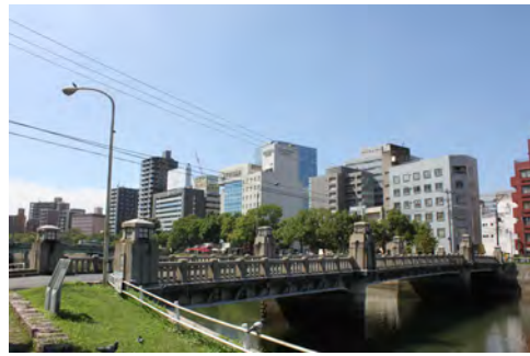
084 42京橋東詰付近から見た京橋