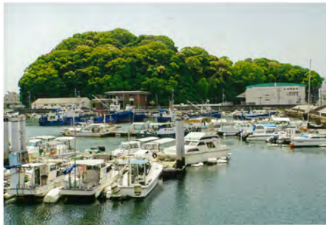
056 63宇品海岸ブロムナードから見た元宇品