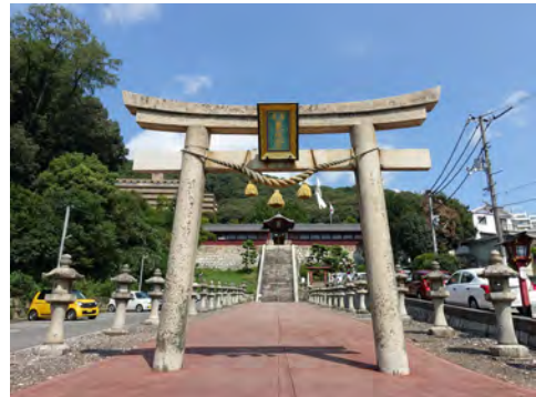
037 21広島東照宮石鳥居から見た広島東照宮