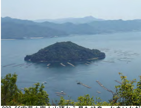
022 66安芸小富士山頂から見た峠島、かきいかだ