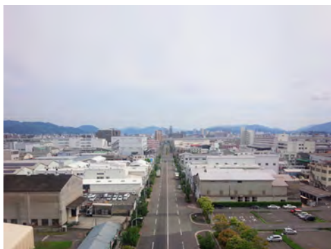
087 98中工場から見た吉島通り北方向