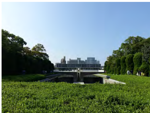
084 8原爆死没者慰霊碑北側から見た慰霊碑、平和記念資料館