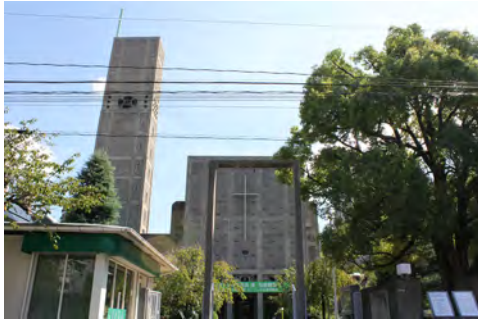
044 17世界平和記念聖堂前から見た聖堂