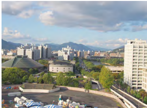
084 12おりづるタワーから見た旧広島市民球場跡地、広島城方向