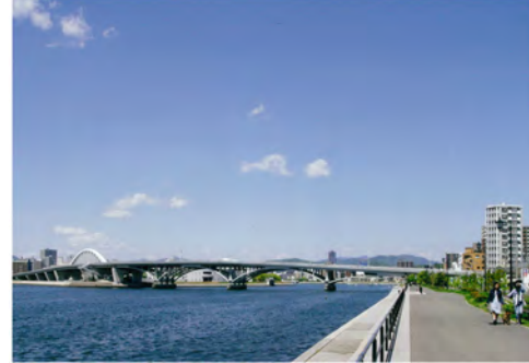
035 47京橋川左岸から見た宇品橋