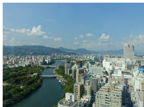
051 9NHK広島放送センタービルから見た原爆ドーム、紙屋町方向