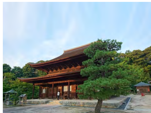
017 25不動院境内から見た金堂