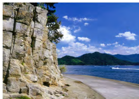
006 (008) 62元宇品海岸から見た瀬戸内海