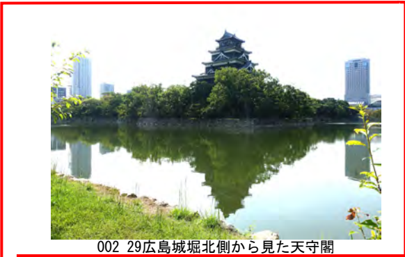
002 29広島城堀北側から見た天守閣