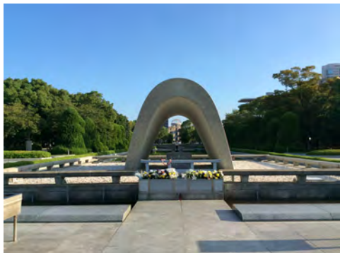
003 2原爆死没者慰霊碑前から見た原爆ドーム