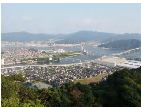
029 73黄金山展望台から見た南区仁保方向