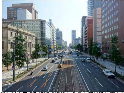
031 91中区袋町横断歩道橋から見た鯉城通り南方向