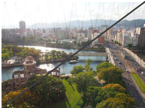
003 (014) 11おりづるタワーから見た原爆ドーム、相生橋