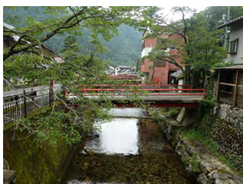
008 59打尾谷川上流から見た湯来温泉