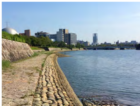
046 37基町環境護岸から見た太田川下流方向