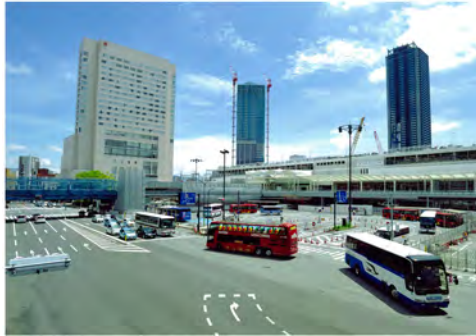
024 87広島駅新幹線口ペDESTリアンデッキから見た新幹線口広場