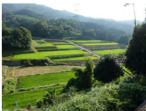
010 70安佐北区白木町桧山地区から見た田園