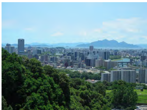
039 78神田山荘から見た市街地