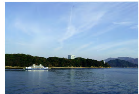
065 61広島港沖から見た元宇品