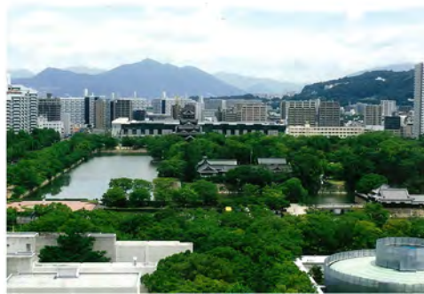
034 30NTTクレド基町ビルから見た広島城