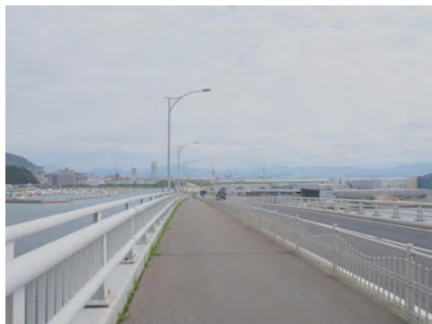
075 58はつかいち大橋から見た五日市方面