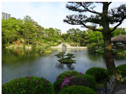
005 18縮景園内超然居から見た広島駅方向