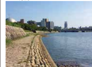
37 基町環境護岸から見た太田川下流方向