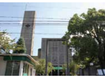
17 世界平和記念聖堂前から見た聖堂