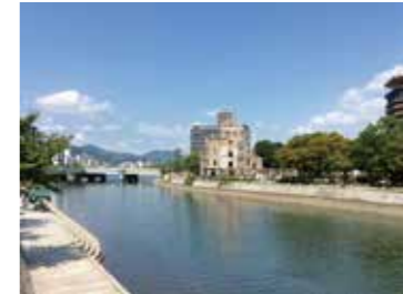
3 元安橋西詰から見た原爆ドーム