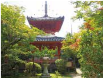
23 三瀧寺参道から見た多宝塔