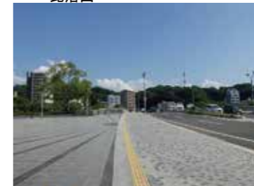
43 鶴見橋西詰付近から見た鶴見橋、比治山