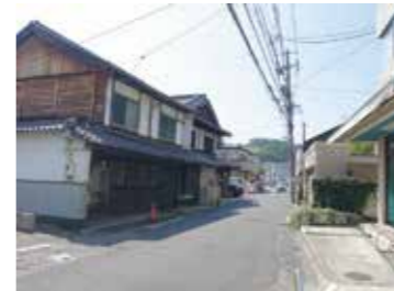
34 安芸区船越から見た西国街道