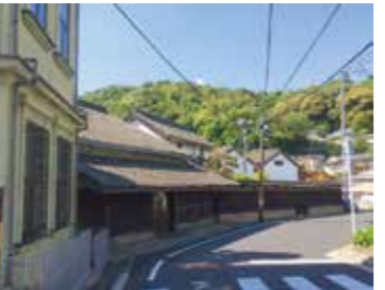
32 西区草津から見た草津街道