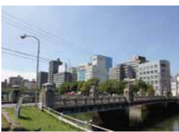
42 京橋東詰付近から見た京橋