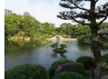
18 縮景園内超然居から見た広島駅方向