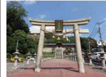
21 広島東照宮石鳥居から見た広島東照宮