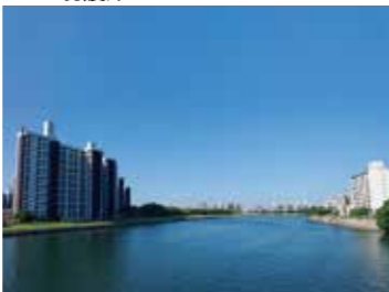
39 三篠橋から見た基町住宅、基町環境護岸