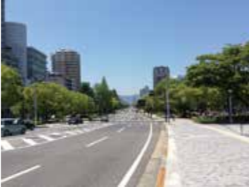
15 鶴見橋西詰付近から見た平和大通り