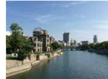
4 相生橋から見た元安川下流方向