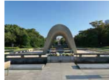
2 原爆死没者慰霊碑前から見た原爆ドーム