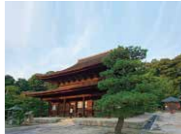
25 不動院境内から見た金堂