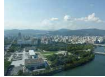
10 NHK広島放送センタービルから見た平和記念資料館、平和大通り