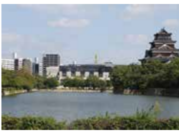
28 広島城堀南側から見た天守閣