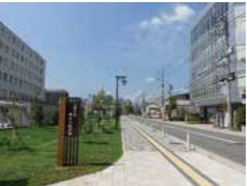
31 東区光町から見た二葉の里歴史の散歩道