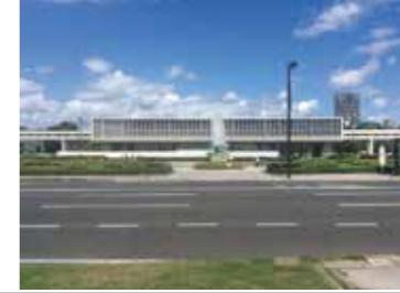
7 平和大通りから見た平和記念資料館