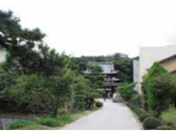
24 不動院参道から見た楼門