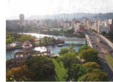
11 おりづるタワーから見た原爆ドーム、相生橋