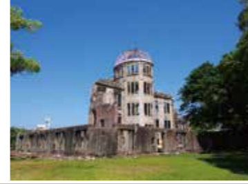
6 原爆ドーム東側から見た原爆ドーム