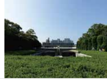
8 原爆死没者慰霊碑北側から見た慰霊碑、平和記念資料館