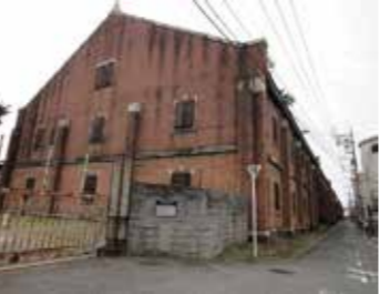
16 旧広島陸軍被服支廠前から見た被服支廠