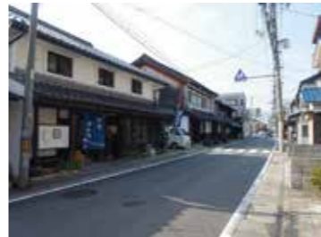
33 安佐北区可部から見た可部夢街道