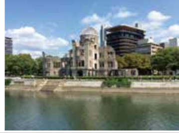
5 原爆ドーム対岸から見た原爆ドーム