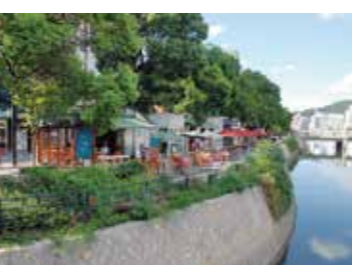
40 稲荷大橋から見た水辺のオープンカフェ