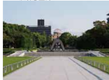
1 平和記念資料館前から見た原爆死没者慰霊碑