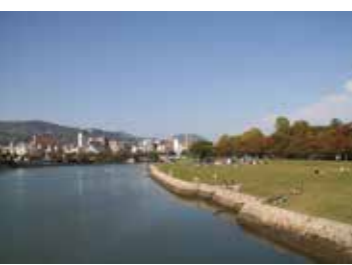
38 空鞆橋から見た基町環境護岸