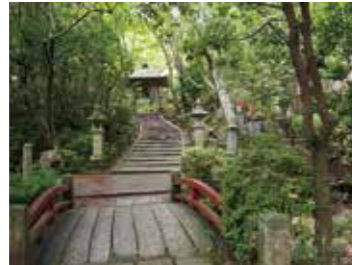
22 三瀧寺参道から見た鐘楼