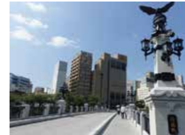
35 猿猴橋北詰から見た猿猴橋