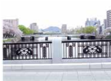
36 猿猴橋から見た荒神橋、黄金山