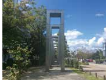
14 平和大通りから見た平和の門