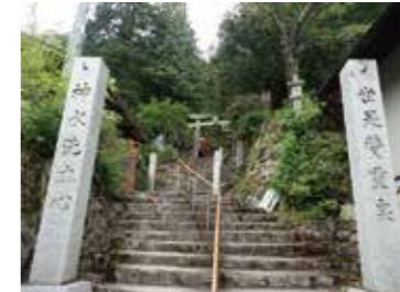
27 湯山明神社参道から見た湯ノ山旧湯治場付近