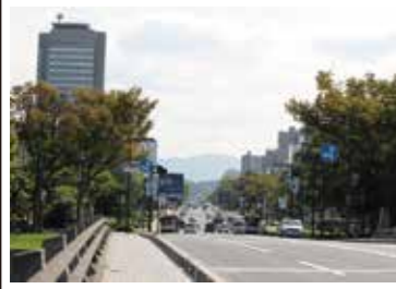
13 西平和大橋から見た平和大通り、比治山