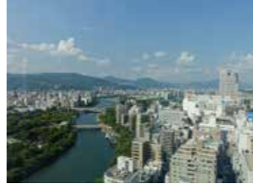
9 NHK広島放送センタービルから見た原爆ドーム、紙屋町方向