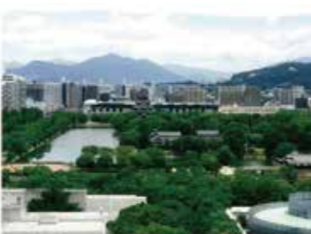
30 NTTクレド基町ビルから見た広島城