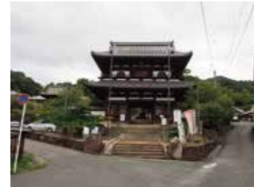
26 國前寺前から見た山門