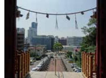
20 広島東照宮唐門から見た広島駅方向