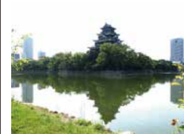
29 広島城堀北側から見た天守閣