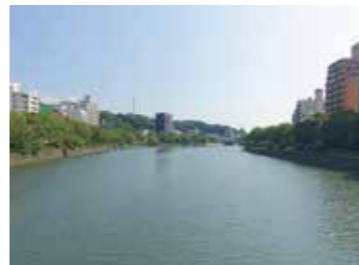
41 東広島橋から見た河岸緑地