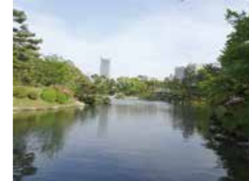
19 縮景園内濯纒池西側から見た広島駅方向