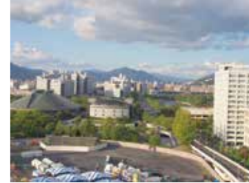
12 おりづるタワーから見た旧広島市民球場跡地、広島城方向