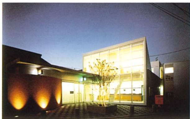
広島牛田新町郵便局 (建築物・工作物部門)