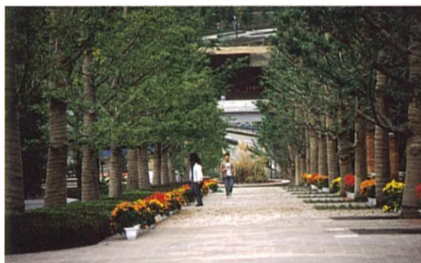
広島修道大学ハーモニーロード (緑化推進部門)