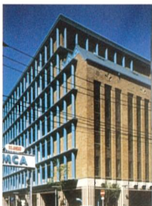
カーパーク八丁堀 (OKAMOTO B.L.D.G.) (街並み部門)