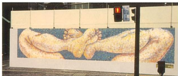
アートの描かれた仮囲い (サイン・アート部門)