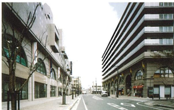
五日市駅北口地区市街地再開発組合 (まちづくり活動部門)