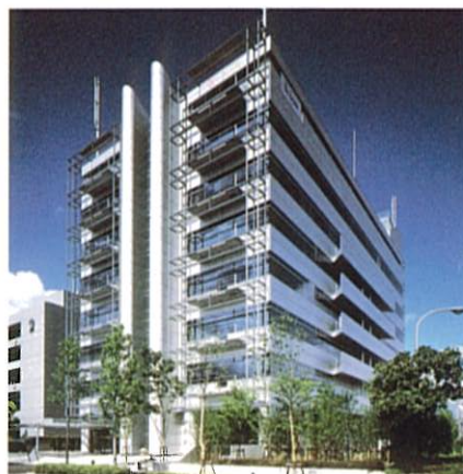
NTT DoCoMo 中国ビル (建築物・工作物部門)