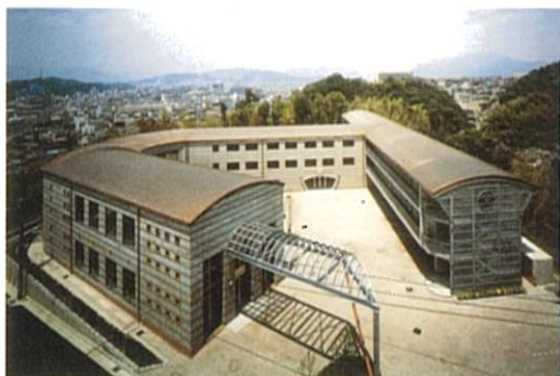
CEC dormitory (建築物・工作物部門)