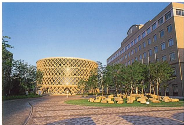
広島女子大学 (街並み部門)