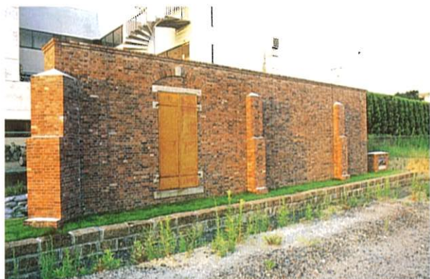
旧広島陸軍糧秣支廠倉庫のレンガ壁モニュメント (サイン・アート部門)