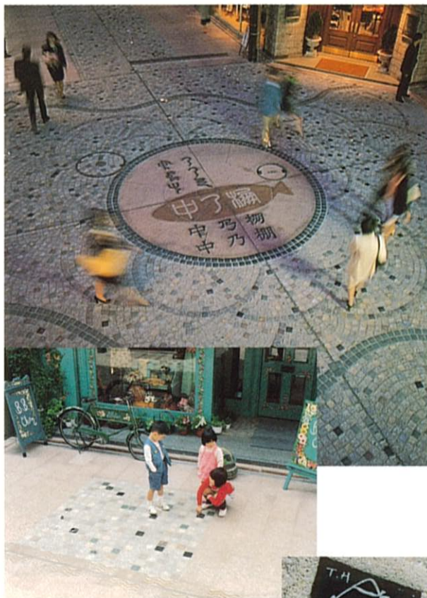
広島市中の棚商店街振興組合 (まちづくり活動部門)