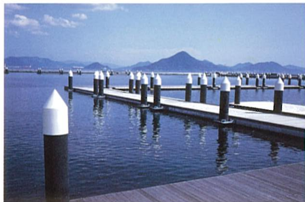
広島観音マリーナ浮棧橋 (建築物・工作物部門)