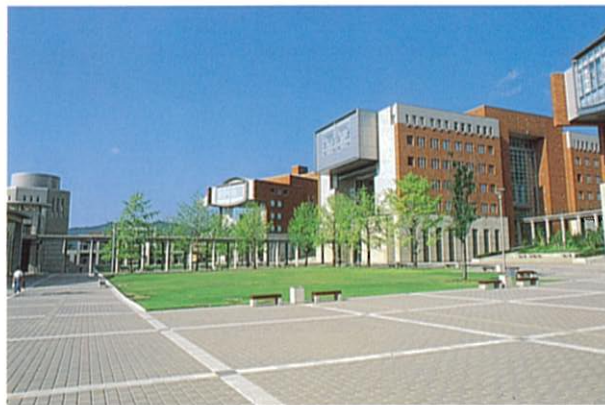
広島市立大学 (建築物・工作物部門)