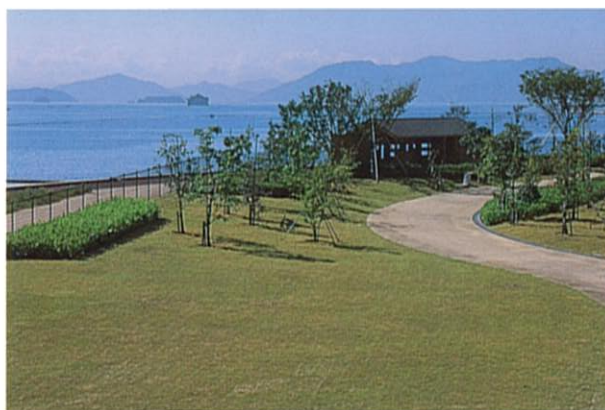
みずとりの浜公園 (緑化推進部門)