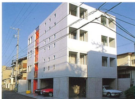
ルミエール霞 (建築物・工作物部門)