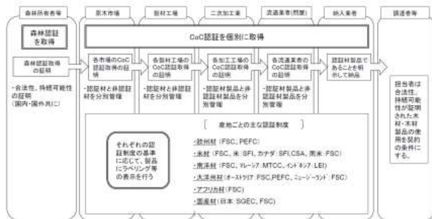
図8 森林認証制度及びC o C 認証制度を活用した証明方法のイメージ