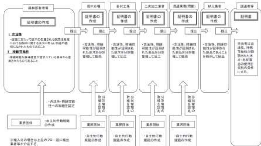
図9 森林・林業・木材産業関係団体の認定を得て事業者が行う証明方法のイメージ図