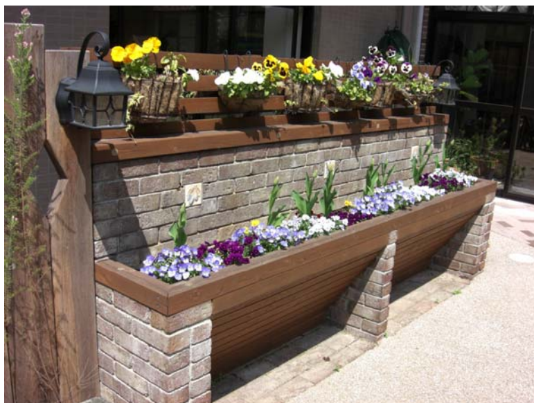
花壇とハンギングバスケット