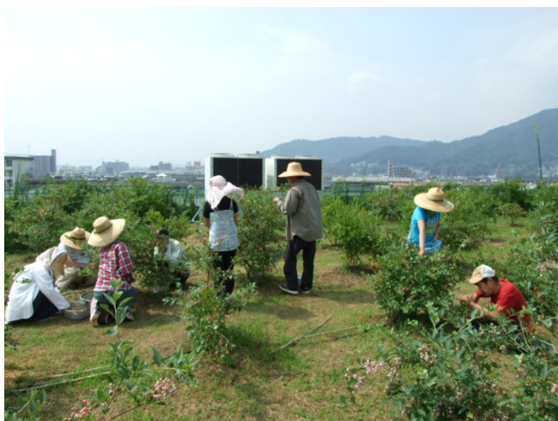
ブルーベリーの収穫風景