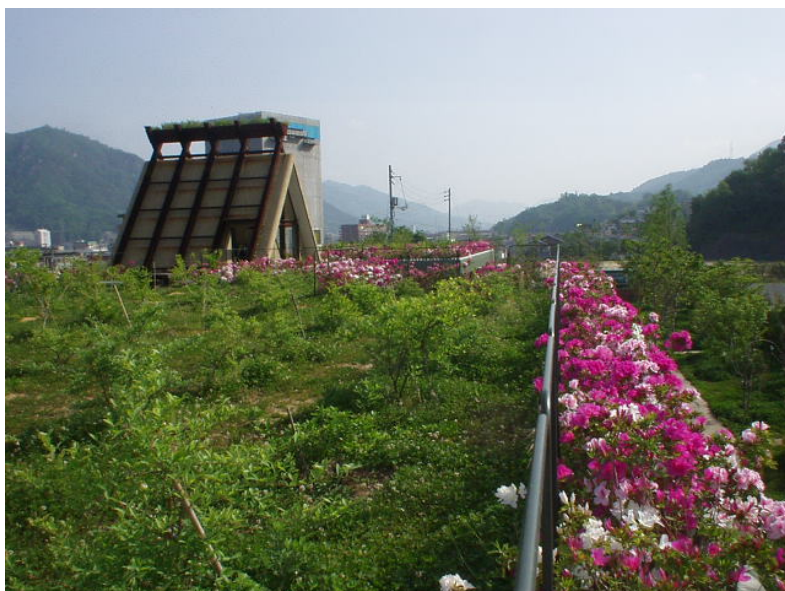
屋上の様子 (ブルーベリー畑と花を咲かせたヒラドツツジ)