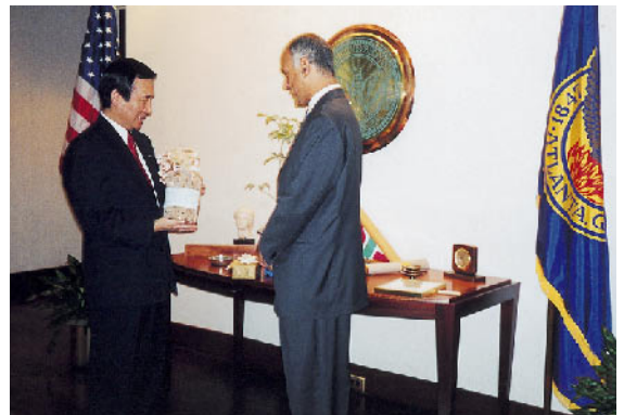
アトランタ市からのハナミズキ種子の寄贈 平成12年(2000年)10月

Donation of dogwood seeds from the City of Atlanta (October 2000)