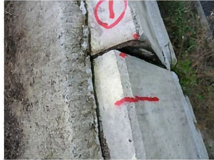
傾倒による目地ズレ