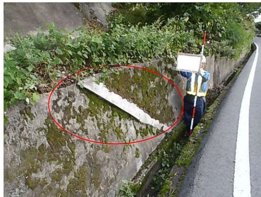
写真では亀裂補修後もせり出しが進展している