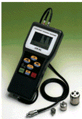
図-1 超音波厚さ計の一例

板厚調査の対象は、塗膜厚を含まない鋼母材厚である。超音波パルス反射法を利用した機器には、塗膜厚を含まない鋼母材厚を検出する機能を有するものと、そうでないものがある。後者の機器を用いた場合は、別途、塗膜厚を調査して測定値から差し引く必要がある。塗膜厚は、工場製作時の値を用いるか、膜厚計により測定するのがよい。