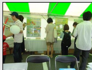
【「環境の日」ひろしま大会】