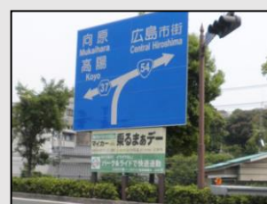
【横断幕の掲示(祇園新橋南)】