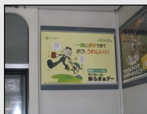
【アストラムライン車内】