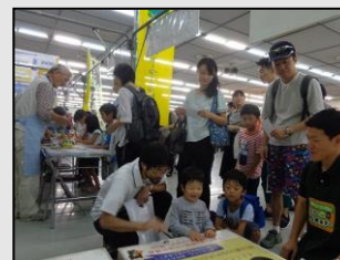
【ひろしまバスまつり】