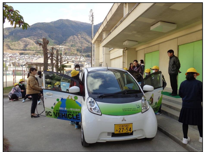
【電気自動車(三菱アイミーブ)の見学】