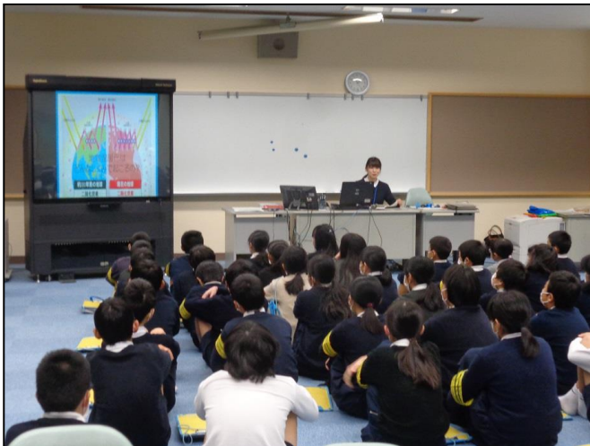
【パワーポイントによる授業】

分かりやすい学習となるよう、地球温暖化のしくみや自動車の問題点などをパワーポイントで説明するとともに、身近にできる地球温暖化防止の取組によるCO 2 削減量をビニール袋で比較したり、電気自動車を見学するなどの体験学習も実施しました。