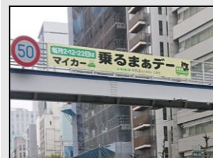
【横断幕の掲示(相生通り)】