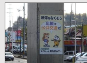
【サンフレッチェとの共同広告】