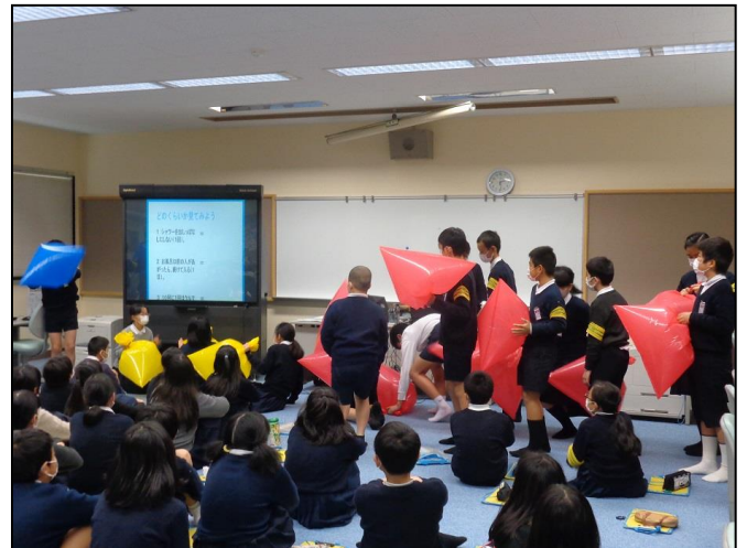
【CO 2 削減量の可視化】