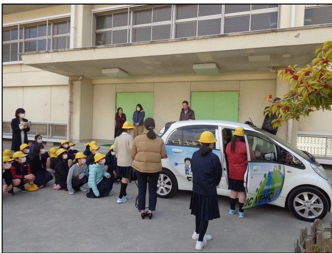
【電気自動車(三菱アイミーブ)の見学】