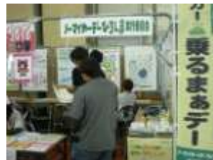
【ひろしまバスまつりにおける出店ブースの様子】