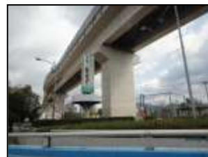
【淵崎公園の広告塔】