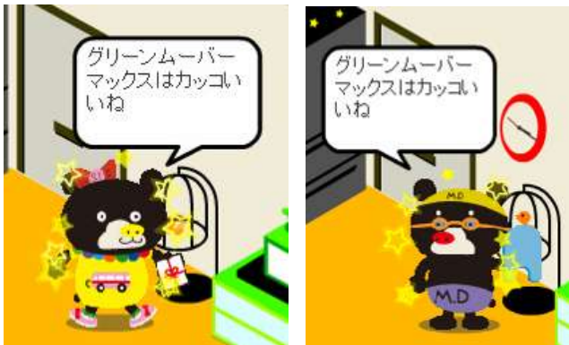
【作品のキャラクター化イメージ】