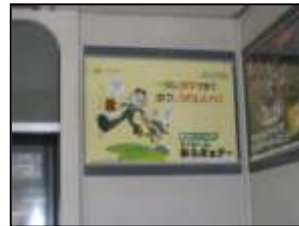
【アストラムライン車内】