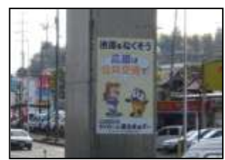
【サンフレッチェとの共同広告】