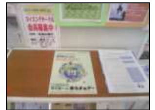
【東区スポーツセンター】