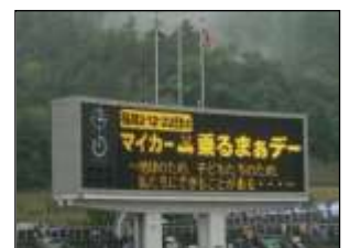
【サンフレッチェとの連携(試合会場での大型ビジョンへの掲載)】