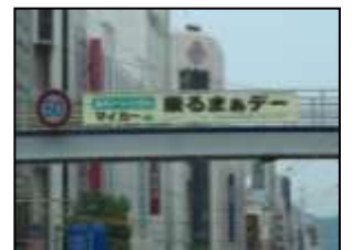
【横断幕の掲示(相生通り)】