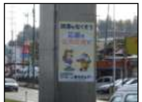
【サンフレッチェとの共同広告】