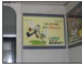
【アストラムライン車内】