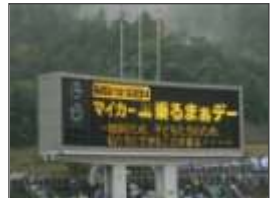
【サンフレッチェとの連携（試合会場での大型ビジョンへの掲載）】