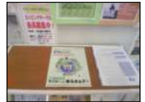
【東区スポーツセンター】