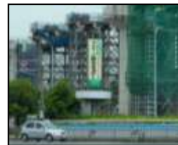
【瀨崎公園の広告塔】