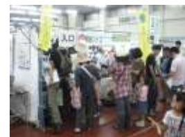
【ひろしまバスまつりにおける出店ブースの様子】