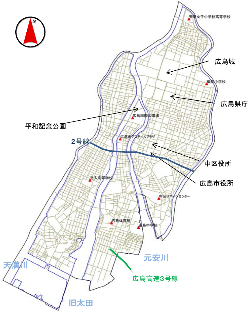
食料や生活避難場所が未整備の生活避難場所(中区)