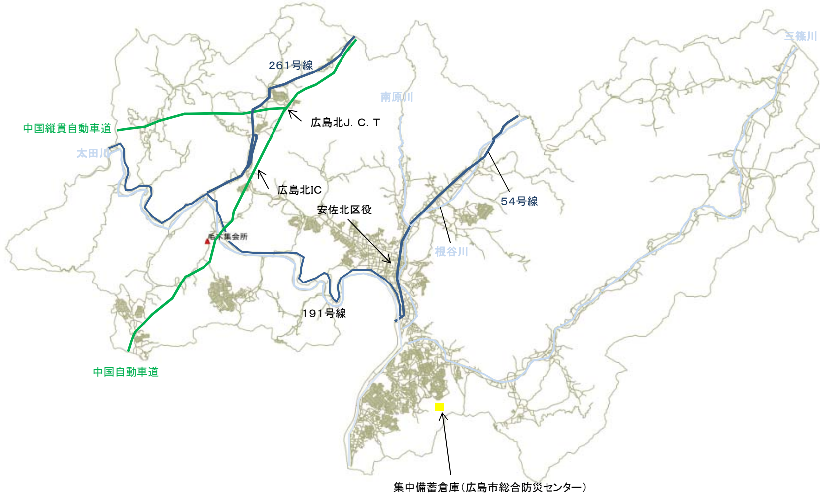
集中備蓄倉庫(広島市総合防災センター)