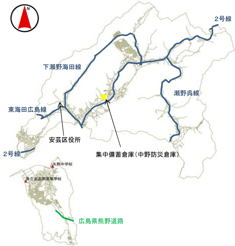
食料や生活避難場所が未整備の生活避難場所(安芸区)