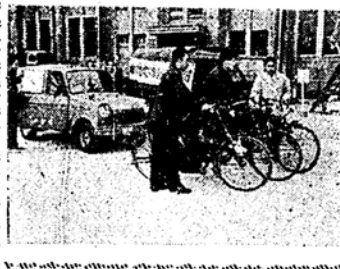
〇月〇日、Cさんのところ... 生活に困っているが、生活保護...