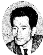
川村 自然に世間はなほしも出まし... ね。手と...