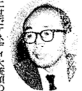
藤井 さん、お話を聞いて、二世代ケネディ大統領の任命ではじめて公職に就いたという感じがする。空襲がこの村井さんのものにあるので、手続もスラスラといきました。

ウワサもあって、彼もセツパツつた気持ちだったのでしよう。ズツとまりこみで仕事をし、家にもかえらず、市役所にも顔を出さなかつたのです。 司会 新谷さんは四十八人の使節団を動かすに気がつかれたことではないでしょうか。