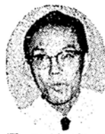
錦田 わたしがホルルの放送局... 一時前あまりの番組に出たとき...