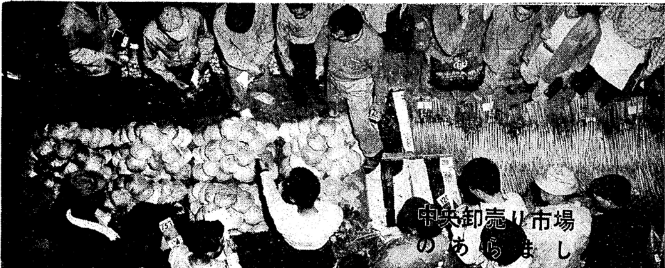
中央卸売(り)市場のあらし

大勢の買出し人がつめかかれたりして、そこでそれぞれが必要とする品物の買出しを短い時間に行なうからです。こうして、買出し人が買っていく品物がやがてみなさんが手にするわけです。ここで、こういふやりかたの意を味を考へてみましょう。まず、卸 「中央卸売(り)市場のあらし」 郵便貯金は 広島市の建設にも 役立つています みなさんの郵便貯金は広島市の建設のためにも役立つています。これまで大蔵省資金運用部をおして市に貸し出したものが、十八億三千五百万円余りになっています。 郵政省では去る九月、十月の二カ月間にわたって、家庭を、郷土を明るく、郵便貯金増強運動を全国的に行ないましたが、こんども、郵便貯金に対するみなさんの理解と協力をお願いいたします。