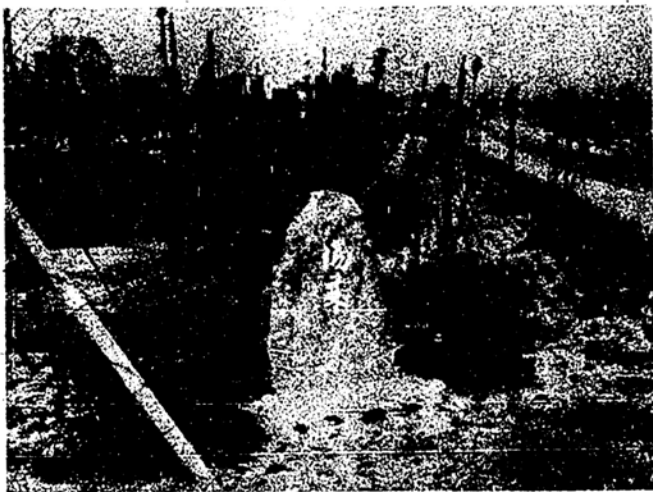
写真は 百米道路の植木の森

夏の魅力は、なんといつても緑の木蔭です。焼けたような暑さをこらえ、海に山に涼をもとめて、人間は自然です。街に緑がないとその街はなんとも淋しく、やわらか味がなく、その街に住んでおる人までさびつな感じを受けます。 広島市も「ビル」や住宅が立ち並び、道路も整備されて、やがて一応中国地方の文化商工業の中心都市になつてきました。これからは街に緑のあるお洒落のある文化都市にしたいものです。そのためには、どうしても緑のある街でなくては行けないと昨年の四月から都市計画の一つとして緑化推進本部を設け、平和大通り、市内の各公園、市内七つの河津にたくさん木を植えてみなさんのいこいの場所をつくることとし、計画実施にうつりました。さいわいにして近郊町村からたいへんよいことだといつて植樹に必要な木は寄付してやろうとほとんど申込があり、本年の六月末日までに山県郡を筆頭に佐伯郡、高田郡、安芸郡、広島市内から三、六二七本の供木を受けました。 今後数年全市にわたつて植樹していきませんが、まず平和大通りから実施して将来は、うつそうと茂る東西に走る一大森林地帯にしようとして、昨年、平和大通りに力を入れてきましたが、順次市内の各公園、沿道、河津のものも植えていきます。