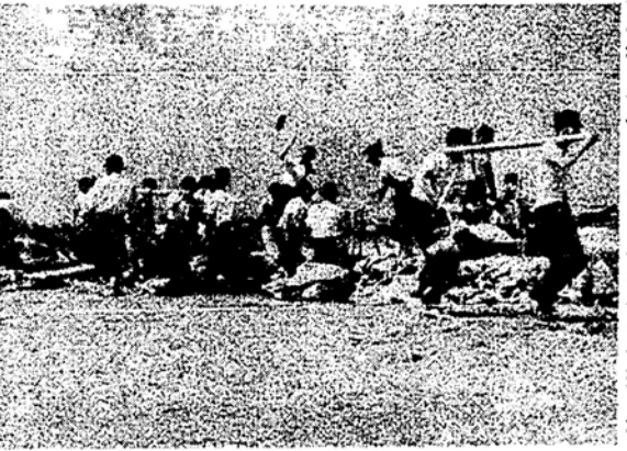
写真は消防団員の水防訓練

みなさん、今年もまた台風の手前が近づいてきました。台風とは、気象が夏型から秋型に変わるとき、南洋方面でできた熱帯性低気圧が強くたつて、中心付近の最大風速が、毎秒十七米以上になつたものをいふのでした。 この台風が雨を伴い、高潮に乗つて一度襲来すると家や土地そのほかの財産を一時にして奪い去る恐ろしい猛威をふるふことは、このたびの九州の災害がよくの語つてあります。 それで、わたし達はこの台風の脅威から逃れるにはどうしたらいいか。 まず、広島市では、この台風を備えて「広島市水防計画」を立て、洪水や高潮が来襲したときの対策を整えています。