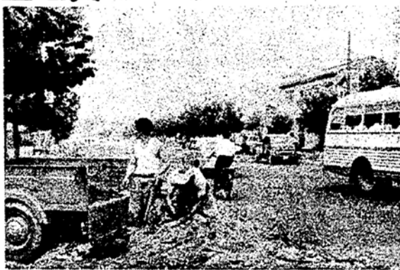
写真は道路舗装工事

所までの延長二百三十二米の舗装を八月一日に竣工、現在最大の努力を払って工事中であります。 この舗装工事は、十一月中旬に終る予定であります。完成の時は、この方面の交通が非常に便利になると思われま