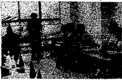
写真は第一回運営協議会

この協議会に代表する委員(七人) △医師、歯科医師または薬剤師を代表する委員(七人) △公益を代表する委員(七人) この協議会に対する連絡は、国民健康保険庶務係で受けます。 不必要な診療には保険給付はいたしません。国民健康保険は、職域の健康保険と全く同じような治療をうけることができます。 病気のやがの場合の診察、薬剤、注射、手当、手術や入院などについてすべて必要な診療をうけることができます。 費用は半額を自分のかかつた医師、歯科医師または薬剤師に直接支払われればあとの半額はその医師、歯科医師または薬剤師の請求によつて市から支払うことになつておりますが、初診料と入院の場合の食事の給与及び寝具設備の給与は、保険給付から除かれ