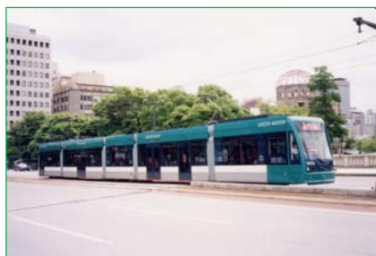
5000形グリーンムーバー