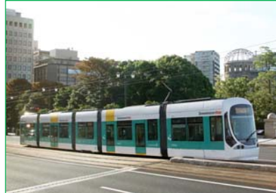
5100形グリーンムーバーマックス