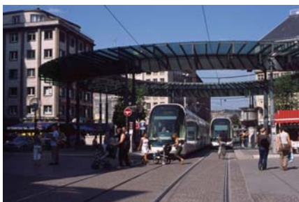
ストラスブール (フランス)