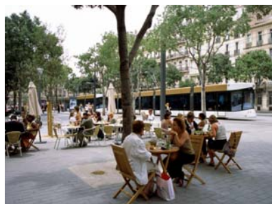
マルセイユ (フランス)