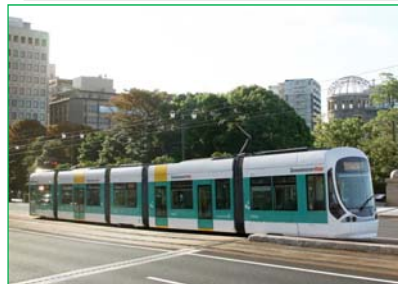
5100形グリーンムーバーマックス