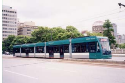
5000形グリーンムーバー