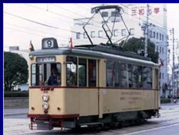
ドイツ・ハンノーバー市