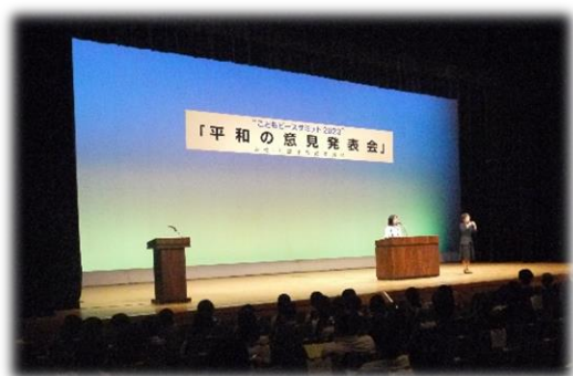
▲令和5年度の「平和の意見発表会」の様子

“こどもピースサミット2024”では、平和の大切さについて感じたことや誰もが大切にされる学校や社会を築くこと、人々と支え合い、つながりを広げ深めながら、平和な社会をつくっていくことなどについて20人の代表児童が意見を発表します。