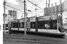
広電ラッピング電車