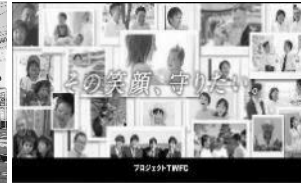
連携協定締結した民間企業と作成した健診(検診)啓発動画