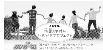
民間ラジオ局と全国健康保険協会広島支部と共催のラジオキャンペーン