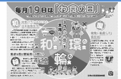
3つの「わ食」啓発用チラシ