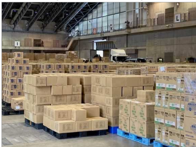
1次物資拠点：県 (石川県産業展示館)