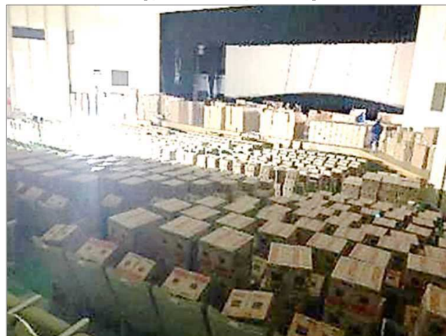
2次物資拠点：各市町 (輪島市文化会館)