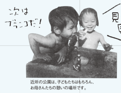
近所の公園は、子どもたちはもちろん、お母さんたちの憩いの場所です。