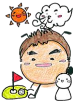
社会福祉士 佐々木 亮