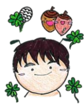
ケアマネジャー 中村 尚史