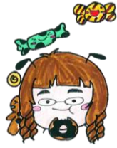
保健師 谷口 百合香