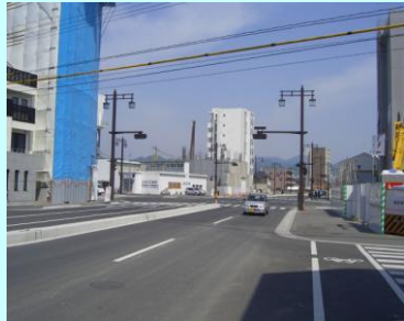
○都市計画道路 比治山東雲線 平成20年6月開通