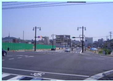
○都市計画道路 段原蟹屋線 平成21年3月開通