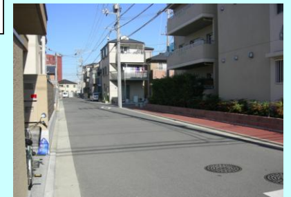
■土地区画整理事業により新しく生まれ変わった街並み