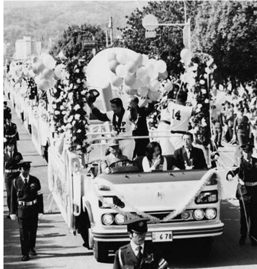
1975（昭和50）年10月20日、広島市平和大通りで行われた優勝パレード

昭和50（1975）年の、新幹線の広島開通とカーブ初優勝を皮切りに西部開発事業や基町再開発などの整備事業が行われ、広島市が政令指定都市になり、昭和60（1985）年には人口が100万人を突破するなど、まさに広島が変化・発展していった時期でした。