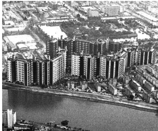
1978（昭和53）年 基町再開発事業完了

そんな観点から、この昭和50年代を“地歴ウォーク”的にふり返ってみようという写真展を企画しました。年配者から若い方々まで、この生き生き、ワクワクした昭和50年代の広島にタイムスリップし、まちかどに入り込んでいただきたいと思います。広島がどう変わっていけばいいのを知手がかりにもきつとなると信じています。