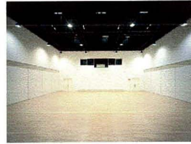
1. 中央図書館 2. スタジオ A（客席は地下に収納できる） 3. スタジオ B（壁は取り外し可能で自然光も取り入れできる）