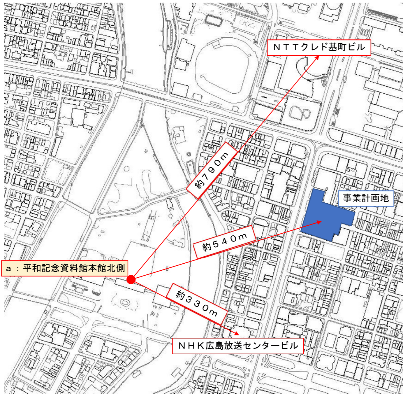
a : 平和記念資料館本館北側 (準備書 (案) 符号7)