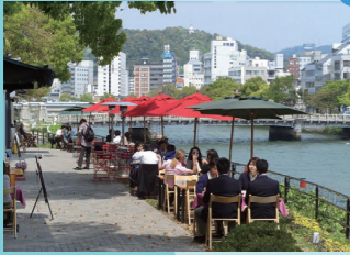
水と緑にふれることができるまち