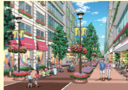
花と緑と音楽のあふれるまち