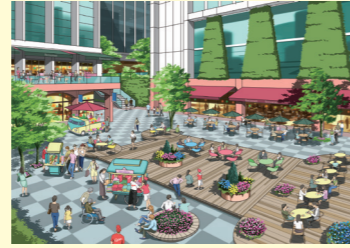
まちなかのにぎわい空間