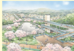
比治山公園「平和の丘」構想の推進