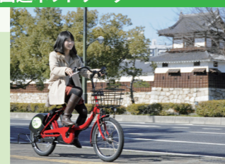
誰もが快適にめぐることができるまち