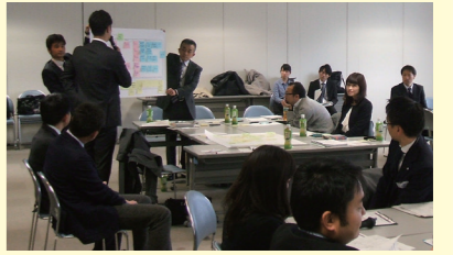
地域主体のまちづくり