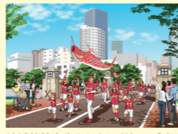
地域特性を生かしたにぎわいづくり