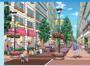
花と緑と音楽のあふれるまち