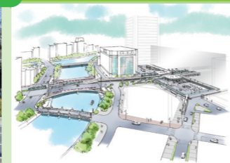
誰もが利用しやすい交通拠点