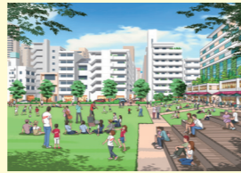
リビングのような公園