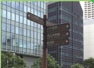
誰もがスムーズに回遊できるまち