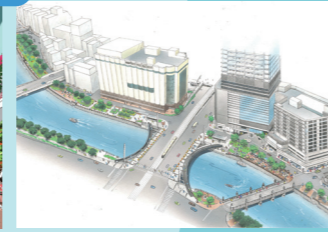
水の都ひろしまにふさわしい水辺