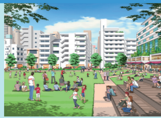
リビングのような公園