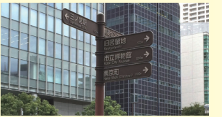
わかりやすい案内・サイン