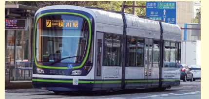
だれもが移動しやすい交通環境