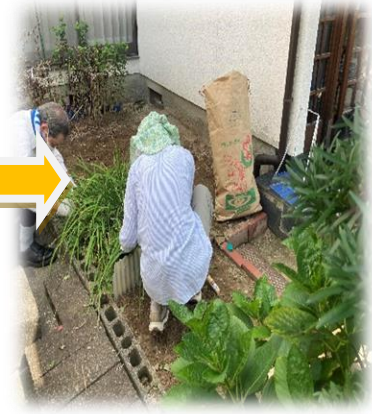
地域ボランティアバンク