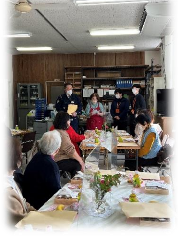
ふれあいきいきサロン