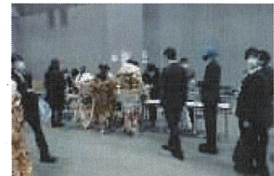
アンケート回答者抽選（サブホール）