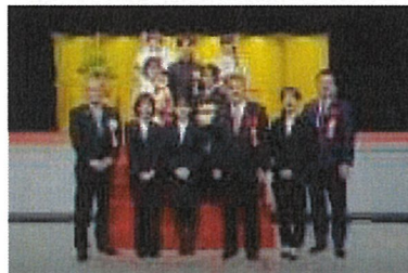
主催者・来賓・実行委員