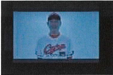
著名人からのビデオメッセージ