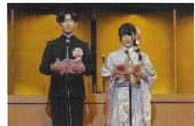
二十歳の誓い（第1部）