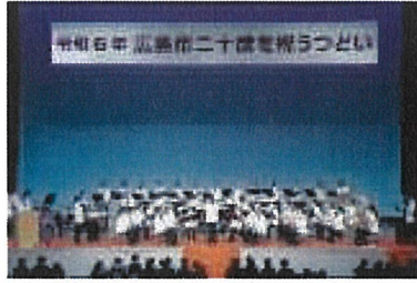
オープニングアトラクション 基町高校器楽部