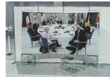
フォトスポット（サブホール） G7広島サミットパネル