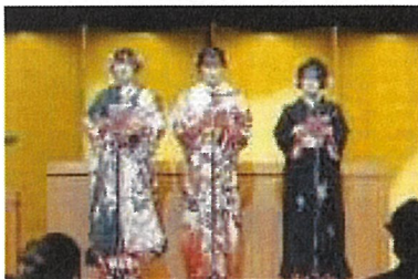
二十歳の誓い（第2部）