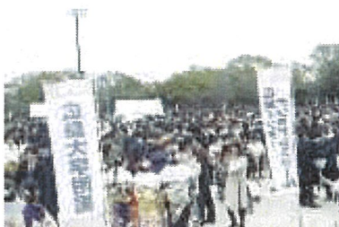
同窓広場（西側公園）