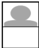
縦横の比率があっていないもの