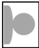
写真が横向きになっているもの