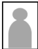
全身写真になっているもの