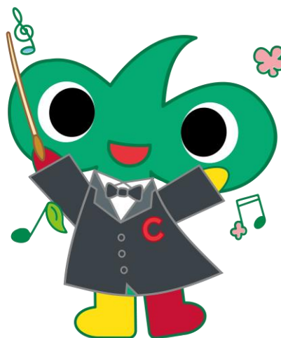
中区のまちづくりのマスコットキャラクター なかちゃん