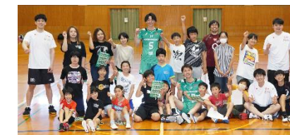
（JTサンダース広島及び広島ドラゴンフライズの選手による合同スポーツ教室）