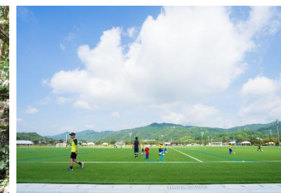
（人工芝グラウンドの整備イメージ）