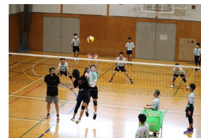
（トップス広島バレーボール学校サマー合宿）

地域をアピールするためのモデル合宿等を継続しつつ、合宿・アクティビティ等のパッケージ化や、問い合わせ対応のワンストップ化により合宿誘致を本格的に進めていきます。また、合宿地として選ばれるために、湯来体育館に空調機の新設導入やトレーニング室のウエイト器具の補充、湯来南運動広場に少年サッカーや野球等で利用できる人工芝の整備などのスポーツ施設の整備にも取り組んでいきます。