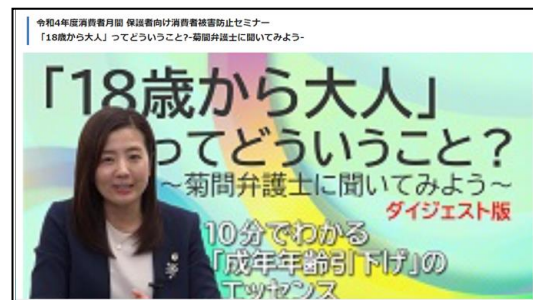
「18歳から大人」Twitter アカウント 「18歳から大人ってどういうこと」動画 等