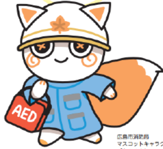
広島市消防局 マスコットキャラクター 「もみりん」