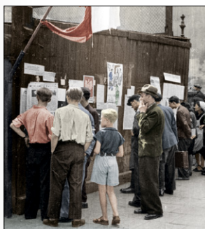
写真: ワルシャワ蜂起映像のカラーフレーム (反乱軍のニュースフィルムから作成)、 ワルシャワ蜂起博物館所蔵